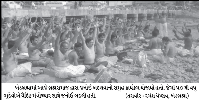
ખેડબ્રહ્મામાં આજે બ્રહ્મસમાજ દ્વારા જનોઈ બદલવાનો સમુદ્ધ કાર્યક્રમ યોજાયો હતો. જેમાં ૫૦ થી વધુ ભુદેવોએ વૈદિક મંત્રોચ્ચાર સાથે જનોઈ બદલી હતી.

ડીસામાં રજુઆત કરવા આવેલ નાગરિક સાથે ચીફ ઓફીસરનું ઉદ્ધતાઈભર્યું વર્તન