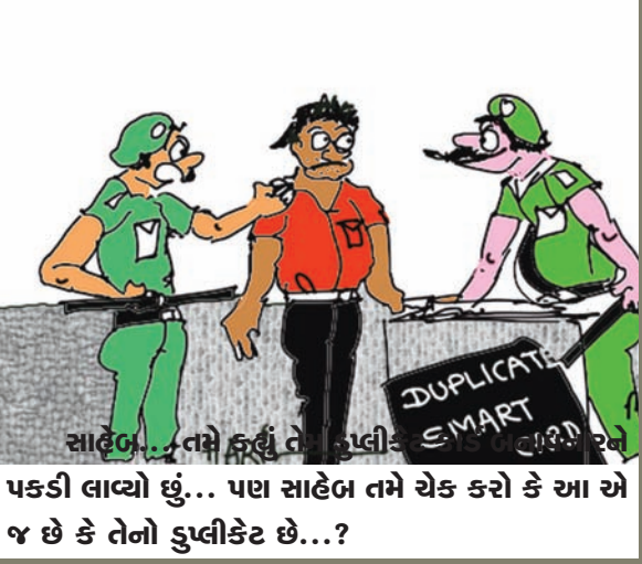
પકડી લાવ્યો છું... પણ સાહેબ તમે ચેક કરો કે આ એ જ છે કે તેનો ડુપ્લિકેટ છે...?