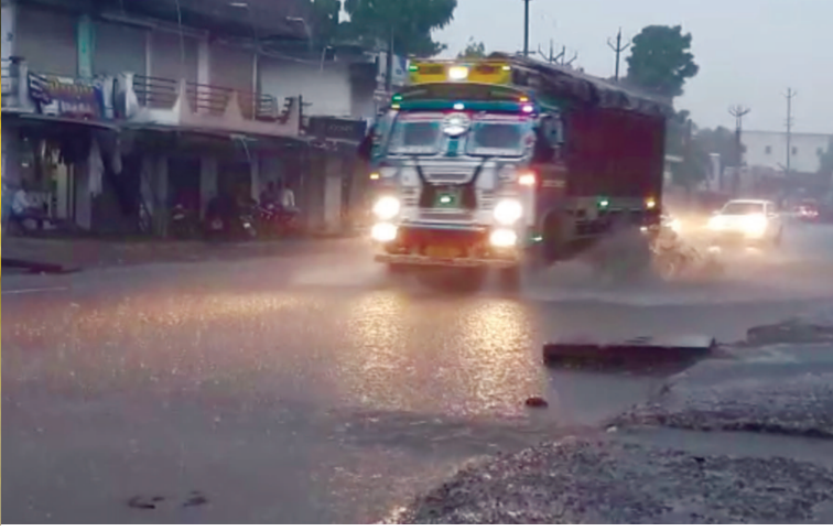
અરવલ્લી જિલ્લાના ધનસુરામાં ધોધમાર વરસાદ વરસ્યો હતો. વરસાદ વરસતા બજાર અને રોડ અને સોસાયટીમાં પાણી ભરાઈ ગયા હતા. વિરામ બાદ વરસાદ વરસતા વાતાવરણમાં ઠંડક પ્રસરી ગઈ હતી.