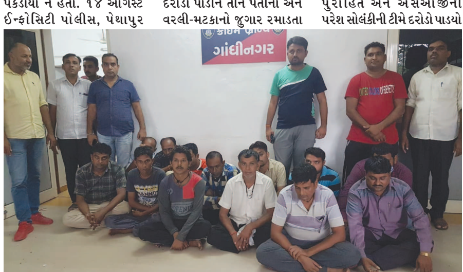
પોલીસ, સાંતેજ પોલીસ, માણસા પોલીસ અને કલોલ શહેર પોલીસ દ્વારા અલગ-અલગ સ્થળોએ શકુનીઓને પકડી પાડ્યા હતા. આ ટીમોએ અલગ અલગ છ સ્થળે દરોડા પાડીને ૧૬ જુગારીઓને પકડ્યા હતા. જ્યારે ૧૫ ઓગસ્ટે રંખિયાલ પોલીસે ચાર જુગારીઓને પકડ્યા હતા. તે ઉપરાંત ગઈકાલે માણસા પોલીસ સ્ટેશનની હદમાં લોદરા ગામે જુગાર ધામ પર ગાંધીનગર એલસીબી પીઆઈ જે.ડી. હતો અને સવા લાખના મુદામાલ સાથે ૧૨ શકુનીઓની ધરપકડ કરી લીધી હતી. શ્રાવણની શરૂઆત થી ૫ દિવસ સુધીના સમયગાળા દરમિયાન પોલીસ દ્વારા અગિયાર સ્થળે દરોડા પાડીને રોકડ રૂ.૨,૭૧,૮૩૦ સહિત કુલ રૂ.૩,૭૩,૨૩૦ ની કિંમત ના મુદામાલ સાથે કુલ ૪૮ શકુનીઓની ધરપકડ કરી છે.

ગાંધીનગર, તા. ૧૬ શ્રાવણ માસની શરૂઆત ૧૨ તારીખથી થઈ ત્યારથી આજદિન સુધી પાંચ દિવસના સમયગાળા દરમિયાન ગાંધીનગર જિલ્લાના અલગ અલગ વિસ્તારોમાં પોલીસે દરોડા પાડીને ૧૧ જુગારધામો પકડી પાડ્યા છે. જિલ્લામાં અલગ અલગ અગિયાર સ્થળોએ દરોડા પાડીને પોલીસ દ્વારા રોકડ પોણા ત્રણ લાખ રૂપિયા સહિત કુલ પોણા ચાર લાખની કિંમતનો મુદામાલ જપ્ત કરીને ૪૮ શકુનીઓને જુગાર રમતા રંગેહાથ પકડી પાડ્યા છે. પાંચ દિવસમાં અલગ-અલગ સ્થળોએ દરોડા પાડીને પોલીસે ૪૮ શકુનીઓ પકડ્યા છે ત્યારે જુગારના શોખીનોમાં ફફડાટ ફેલાઈ જવા પામ્યો છે. ગાંધીનગર જિલ્લા પોલીસ અધિક્ષક મયુર ચાવડાની સૂચનાથી એલ.સી.બી. - એસ.ઓ.જી સહિત સ્થાનિક પોલીસની ટીમો શકુનીઓને પકડવા સક્રિય છે. શ્રાવણ માસની શરૂઆતથી આજદિન સુધીમાં એટલે કે પાંચ દિવસના સમયગાળા દરમિયાન એલ.સી.બી.એસ.ઓ.જી સહિત સ્થાનિક પોલીસ દ્વારા જિલ્લામાં કુલ ૧૧ અલગ અલગ સ્થળો પર સફળ દરોડા પાડવામાં આવ્યા છે. ૧૨ ઓગસ્ટે કલોલ તાલુકા સેક્ટર-૭ અને રંખિયાલ પોલીસ દ્વારા પોતાના વિસ્તારમાં દરોડા પાડીને ૧૮ શકુનીઓને પકડ્યા હતા. બીજે દિવસે ૧૩ તારીખે એક પણ જુગારી જિલ્લામાંથી પકડાયો ન હતો. ૧૪ ઓગસ્ટે ઈન્ફોસિટી પોલીસ, પેથાપુર દરોડા પાડીને ત્રણ પતીનો અને વરલી-મટકાનો જુગાર રમણતા પુરોહિત અને એસઓ જીની પરેશ સોલંકીની ટીમે દરોડો પાડ્યો