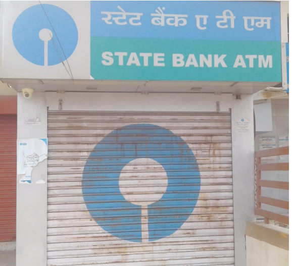
તાજેતરમાં જ બેંક અધિકારીઓ દ્વારા આ એટીએમ પર તેના તરફ સિક્યુરિટી ગાર્ડને ત્યાંથી મેનેજરે માણસા પોલીસ સ્ટેશનમાં આ મામલે ફરિયાદ નોંધાવી છે. ગાંધીનગર એફ.એસ.એલ.માં સાયન્ટિફિક ઓફિસર જી.પી. દરબારે સ્થળ પરથી કેટલાક સેમ્પલ લઈ ચોર સુધી પહોંચવાની કડી મેળવવા પોલીસને મદદ કરવા પ્રયત્નો શરૂ કર્યા છે.

ગાંધીનગર, તા. ૧૬ જિલ્લાના માણસા તાલુકાના ઈશ્વરપુરા ગામ પાસે ડાઇવે પર આવેલા એસબીઆઈના એટીએમ ને ચોરે ટાર્ગેટ બનાવ્યું હતું. રાત્રે અઢી વાગ્યાના અરસામાં એટીએમ કેબીનમાં ઘૂસીને તમામ ઈલેક્ટ્રીક સ્વીચ બંધ કરી દઈ ચોરે ગેસ કટર ચાલુ કરી દીધું હતું. અઢી કલાક સુધી મહેનત કરીને એટીએમનું કેસ ઓપન કરીને ચોરે અંદરથી રૂપિયા ૨૩ લાખ રોકડા ચોરી કરી ગયો હતો. વહેલી સવારે પોલીસને ઘટના અંગે જાણ થતાં પોલીસ દોડતી થઈ ગઈ હતી. પોલીસે સીસીટીવી ફૂટેજ રિકવર કરવા પ્રયત્નો શરૂ કર્યાં છે તો બીજી તરફ સ્પીકર ડોગ અને એફ.એસ.એલ બોલાવી વેજાનિક ઢબે પણ તપાસ શરૂ કરી છે. ચોર જે માસ્ક પહેરીને આવ્યો હતો તે માસ્ક તથા હથોડી અને ટાંકણ સહિતનો મુદામાલ પણ સ્થળ પરથી મળી આવ્યો છે. નોંધનીય બાબતો એ છે કે