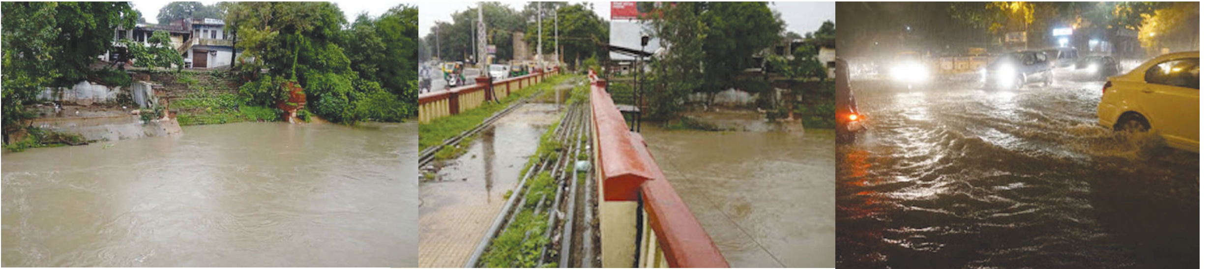
વડોદરામાં જળબંબાકાર... મેઘરાજા રાજ્યભરમાં મહેર કરી રહ્યા છે. દક્ષિણ ગુજરાત અને સૌરાષ્ટ્ર બાદ મેઘરાજાની સવારી વડોદરામાં આવી પહોંચી હતી. ચાર-પાંચ કલાકમાં તો આખું વડોદરા જળબંબાકાર થઈ ગયું. છેલ્લા અહેવાલ પ્રમાણે અમદાવાદમાં પણ બુધવારની સાંજે મેઘરાજા મન મૂકીને વર્ષા. છેક વેષ્ણોદેવી સુધી મેઘરાજાની મહેર થઈ. હવે આ મેઘરાજા વાજતે ગાજતે ગાંધીનગર પધારે એવી સૌ ગાંધીનગરવાસીઓની અરજ છે...