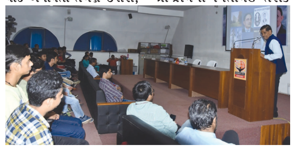
પીઆરએલઆઈઆઈએમ અને અટીરાને પણ માર્ગદર્શન આપ્યું હતું. તે જણાવતા યાદ કર્યું હતું કે “ડો. સી.વી. રામને પણ ડો. સારાભાઈને બંને તરફથી સળગતી ચિનગારી જેવા કહી વખાણ કર્યાં હતા.”

સારાભાઈએ આપી હતી.” આ સાથે તેમણે ૨૫ વિદ્યાર્થીઓના પીએચડી માર્ગદર્શક રહ્યાં હોવાના યાદ અપાવતા તેમણે ઈસરો, અમદાવાદી વૈજ્ઞાનિક પરથી પાડવામાં આવ્યું છે. ડો. સારાભાઈને ઈન્ડિયન સ્પેસ યાદ અપાવતા તેમણે ઈસરો, પ્રોગ્રામના પિતામહ તરીકે ઓળખવામાં આવે છે જેઓ ૧૯૧૯માં ૧૨મી ઓગસ્ટે અમદાવાદમાં જન્મ્યા હતા. ગુજરાત કાઉન્સિલ ઓફ સાયન્સ એન્ડ ટેકનોલોજી-ગુજકોસ્ટ તથા ગુજરાત સાયન્સ સીટીના સંયુક્ત ઉપક્રમે યોજાયેલ આ ઉજવણીમાં અંદાજે ૨૦૦થી વધુ એન્જિનીયરીંગના વિદ્યાર્થીઓ ભાગ લીધો હતો.