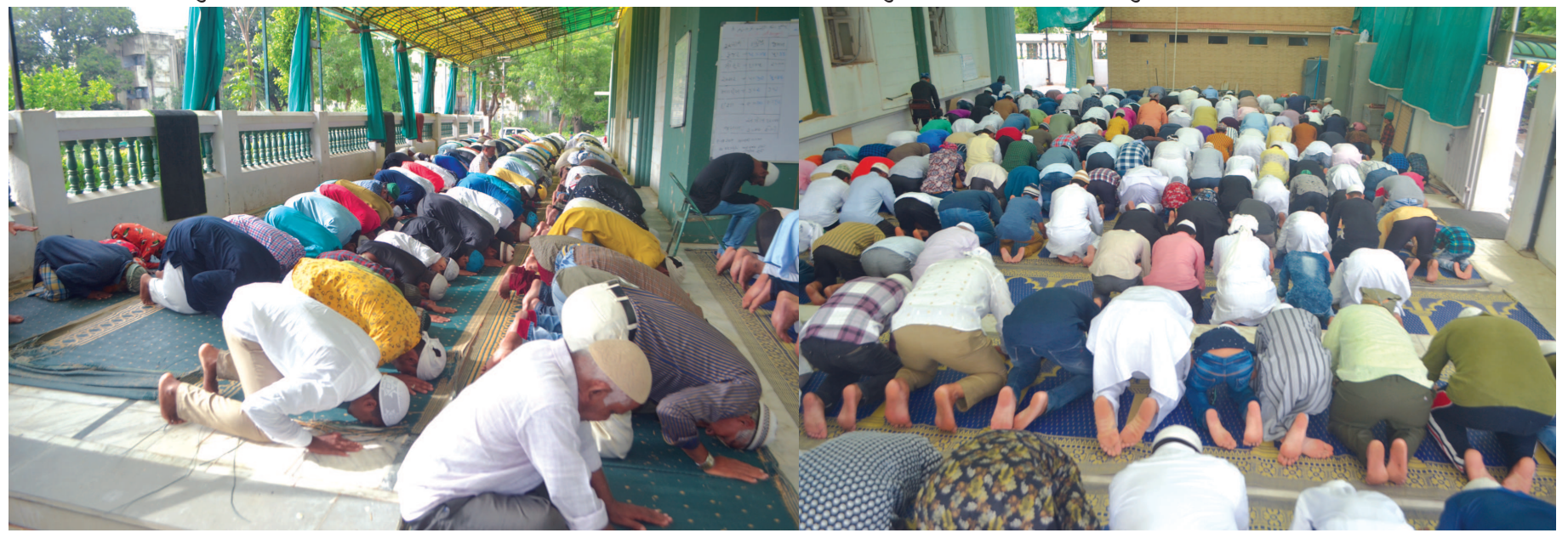
શહેરમાં પવિત્ર શ્રાવણ માસના સોમવારનો અને ઈદ-ઉલ-અઝહાના તહેવારનો સંગમ રચાયો હતો. શહેરની મસ્જિદમાં મુસ્લિમ બિરાદરોએ ઈદની નમાઝ પઢી હતી અને ત્યારબાદ એકબીજાને ઈદની મુબારકબાદી પાઠવી હતી જેમાં નાના ભૂલકાંઓથી માંડીને વડીલો પણ જોડાયા હતા. નમાઝ બાદ મસ્જિદમાં તકરીર યોજાઈ હતી જેમાં ધર્મગુરુએ ઈદનો સંદેશ પાઠવ્યો હતો.