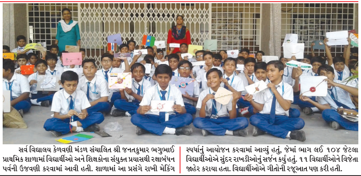
સર્વ વિદ્યાલય કેળવણી મંડળ સંચાલિત શ્રી જનતકુમાર ભગુભાઈ પ્રાથમિક શાળામાં વિદ્યાર્થીઓ અને શિક્ષકોના સંયુક્ત પ્રયાસથી રક્ષાબંધન પર્વની ઉજવણી કરવામાં આવી હતી. શાળામાં આ પ્રસંગે રાખી મેકિંગ સ્પર્ધાનું આયોજન કરવામાં આવ્યું હતું, જેમાં ભાગ લઈ ૧૦૪ જેટલા વિદ્યાર્થીઓએ સુંદર રાખડીઓનું સર્જન કર્યું હતું. ૧૧ વિદ્યાર્થીઓને વિજેતા જાહેર કરાયા હતા. વિદ્યાર્થીઓએ ગીતોની રજૂઆત પણ કરી હતી.