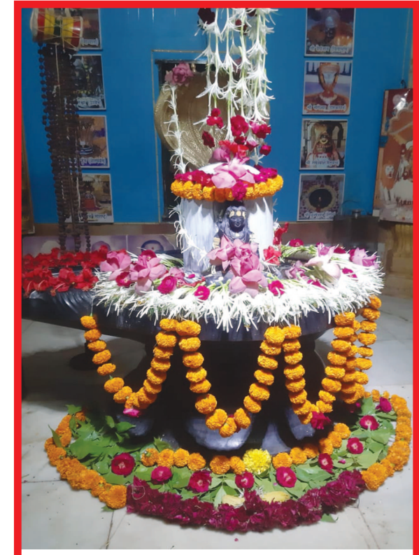
શ્રાવણ માસ પુરો થવા આવ્યો ત્યારે, નગરના ભુવનેશ્વર મંદિરના શિવલિંગને કુલોથી સજાવવામાં આવ્યું છે.

કોરોનાએ કહેર મચાવ્યો છે, પાટનગરમાં પણ કોરોનાના દર્દીઓનો આંક વધતો જાય છે. કોવીડ હોસ્પિટલ દર્દીઓ મોટીસંખ્યામાં સારવાર મેળવી રહ્યા છે. ત્યારે સિવિલમાં ગંભીર સ્થિતિ ધરાવતા કોવીડ દર્દીઓને પ્લાઝમા થેરાપી આપવામાં આવશે. ત્યારે કોરોના પોઝીટીવ દર્દીઓ સ્વસ્થ બન્યા બાદ ૨૮ દિવસ પછી તેમના શરીરમાંથી બ્લડ લેવામાં આવશે અને તેમાંથી પ્લાઝમા અલગ પાડવામાં આવશે. આ પ્લાઝમા કોરોનાના ક્રિટીકલ દર્દીઓને આપવામાં આવશે. જેથી દર્દીઓમાં એન્ટી બોડી પેદા થાય. આ માટે હાલના સમયે કોરોના પોઝીટીવ દર્દીઓ સ્વસ્થ થઈને ઘરે ગયા હોય તેઓને કોલ કરીને પ્લાઝમા ડોનેટ માટે સમજાવવામાં આવી રહ્યા છે. તાજેતરમાં એક દર્દીએ પ્લાઝમા ડોનેટ કર્યું છે. જે દર્દી કોરોના