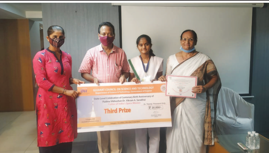
વિક્રમ સારાભાઈ જન્મજયંતી અંતર્ગત યોજાયેલ રાજ્યકક્ષાની સ્પર્ધામાં સંસ્કાર તીર્થ આજોલ, ગાંધીનગરની વિદ્યાર્થીની ત્રીજા ક્રમે વિજેતા થઈ હતી.