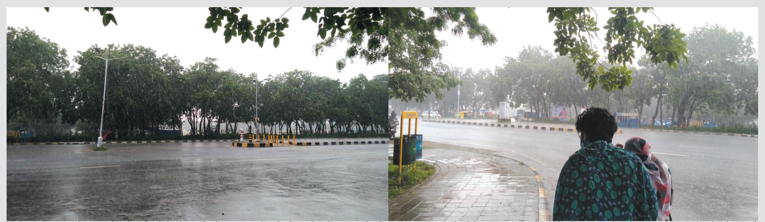
તડકામાં વરસાદ - શહેરમાં બુધવારે માહોલ કઈ અનોખો હતો... ક્યારેક ધોધમાર વરસાદ તો ક્યારેક ધોધમખતો તડકો... આમ તડકો અને વરસાદ સંતાકૂકડી રમતા હોય એવી અદભૂત અનુભૂતિ શહેરીજનોને થઈ હતી... બુધવારે સવારે ૮ થી ૬ સુધી ૧૪ મી.મી. અને સાંજે ૬ થી રાત્રે ૮ વાગ્યા સુધી ૧૧ મી.મી. વરસાદ વરસતા ૧૩ કલાકમાં ૨૫ મી.મી. વરસાદ વરસ્યો હતો...