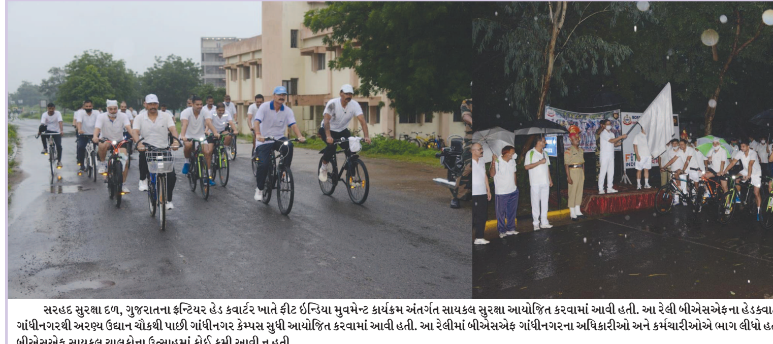
સરહદ સુરક્ષા દળ, ગુજરાતના ફિટ્નેસ હેડ કવાર્ટર ખાતે ફીટ ઈન્ડિયા મુવમેન્ટ કાર્યક્રમ અંતર્ગત સાયકલ સુરક્ષા આયોજિત કરવામાં આવી હતી. આ રેલી બીએસએફના હેડક્વાર્ટરથી વાયુસેના ચૌક, આઈઆઈટી ગાંધીનગરથી અરણ્ય ઉદ્યાન ચૌકથી પાછી ગાંધીનગર કેમ્પસ સુધી આયોજિત કરવામાં આવી હતી. આ રેલીમાં બીએસએફ ગાંધીનગરના અધિકારીઓ અને કર્મચારીઓએ ભાગ લીધો હતો. સવારે વરસાદ પડતો હોવા છતાં બીએસએફ સાયકલ ચાલકોના ઉત્સાહમાં કોઈ કમી આવી ન હતી.