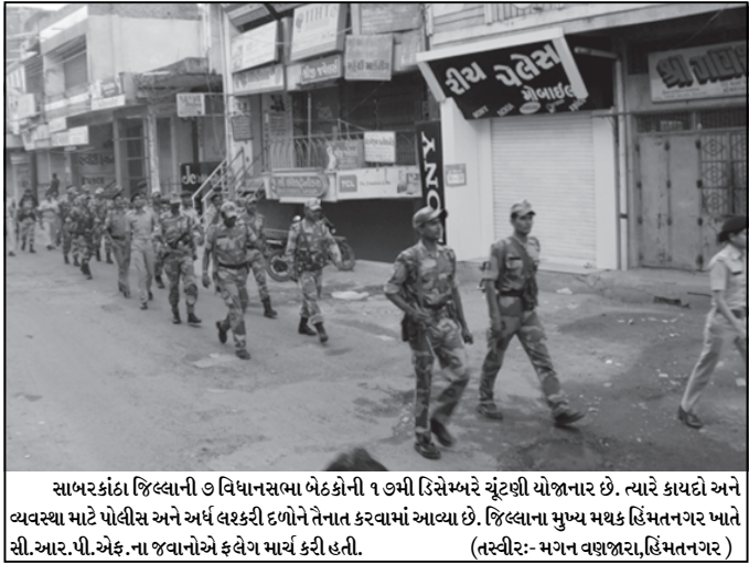
સાબરકાંઠા જિલ્લાની ૭ વિધાનસભા બેઠકોની ૧૭મી ડિસેમ્બરે ચૂંટણી યોજનાર છે. ત્યારે કાયદો અને વ્યવસ્થા માટે પોલીસ અને અર્ધ લશ્કરી દળોને તેનાત કરવામાં આવ્યા છે. જિલ્લાના મુખ્ય મથક હિંમતનગર ખાતે સી.આર.પી.એક.ના જવાનોએ કલેગ માર્ચ કરી હતી.

કરનારાએ જાથાનો પડકાર જીતવા અપીલ કરવામાં આવી છે. ગુજરાતની ચૂંટણી પરિણામોની સચોટ આગાહીમાં (૧) ભા.જ.પ. કોંગ્રેસ કેટલી બેઠકો પર વિજેતા થશે? (૨) સો રાષ્ટ્ર-કચ્છમાંથી ભા.જ.પ.ને કેટલી બેઠકો ઉપર વિજય પ્રાપ્ત થશે? (૩) ઉત્તર-દક્ષિણ ગુજરાતમાંથી કોંગ્રેસને કેટલી બેઠકો ઉપર વિજય પ્રાપ્ત થશે? (૪) વર્તમાન મંત્રીઓમાંથી કેટલા ચૂંટણીમાં હારી જશે? (૫) ગુજરાત પરિવર્તન પાર્ટીને કેટલી બેઠકો ઉપર વિજય મળશે? આ પાંચમાંથી ચારની સચોટ આગાહીમાં સંખ્યામાં એકનો તફાવત માન્ય રાખવામાં આવશે. બે સાક્ષીની હાજરીમાં દસ ટકા રકમ સાથે સોંઘનામાં રૂબરૂ કરવું ફરજિયાત છે. દસ ટકા રકમ ભરનારને ડીપોઝીટનો આધાર આપવામાં આવશે. આગાહીઓ ખોટી પડશે તો ભરેલી રકમ જપ્ત થશે. ડિસેમ્બર ૧૭મી સોમવાર સુધીમાં જાથાનો સંપર્ક કરી માહિતી મેળવી રૂબરૂમાં પડકાર સંબંધી કાર્યવાહી પુરી કરવા અપીલ છે. ભારતભરના આગાહીકારોને પડકાર આપતા જણાવ્યું કે જ્યોતિષને વિજ્ઞાનનો કોઈ આધાર ન હોવાથી પરિણામો સચોટ કરી શકતા નથી. અમદાવાદમાં ગુજરાતભરના જણોતિષીઓ સંમેલનમાં ભેગા થઈ મોટી માટે જીત અથવા વિગેરે ફળકથનો લોકો સમક્ષ મુકવામાં આવ્યા છે.