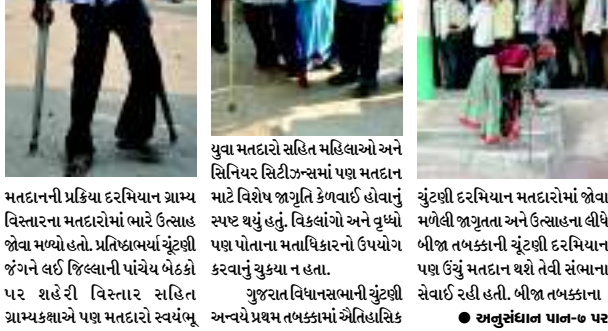
યુવા મતદારો સહિત મહિલાઓ અને સિનિયર સિટીઝન્સમાં પણ મતદાન માટે વિશેષ જાગૃતિ કેળવવાઈ હોવાનું સ્પષ્ટ થયું હતું. વિકલાંગો અને વૃદ્ધો જોવા મળ્યો હતો. પ્રતિષ્ઠાભર્યા ચૂંટણી જંગને લઈ જિલ્લાની પાંચેય બેઠકો પર શહેરી વિસ્તાર સહિત ગ્રામ્ય કક્ષાએ પણ મતદારો સ્વયંભૂ

અન્વયે આજે બીજા તબક્કાની મતદાન કતારમાં ખડા થઈ ગયા હતા.