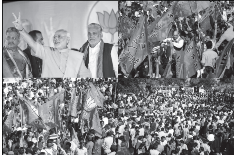
વેદના દાલવાતા વધુમાં જણાવ્યું હતું કે આવા મોટા લોકો આવી હોવાને મને પથ્થરો માર્યા છે અને તેનાથી આજે હેટ્ટીકરી છે. નરેન્દ્ર મોદીને વિજયના વધામણા આપવા

અમદાવાદ, તા. ૨૦ જ્યાં ભાજપના વિપક્ષના વધામણાંરૂપે ભારે આતશબાજી પણ કરવામાં આવી હતી. આ પ્રસંગે યોજાયેલી વિધાનસભાને સંબોધતા મુખ્યમંત્રી નરેન્દ્ર મોદીએ કોંગ્રેસના નેતાઓ અને કેશુભાઈ પટેલનું નામ લીધા સિવાય ભારે આકરા પ્રહારો કર્યા હતા. તેમણે જણાવ્યું હતું કે, ગુજરાતમાં ૮૦ના દાયકામાં ફેલાયેલા શાંતિવાદના ઝેરના દુષ્પરિણામો પ્રજાએ ભોગવ્યા છે અને તેના કારણે મતદારોએ આ ચૂંટણીમાં ૮૦ના દાયકાનું પુનરાવર્તન થવા દીધું નથી અને ક્ષેત્રવાદ તથા શાંતિવાદના ઝેરીલા પ્રચારથી ઉપર ઉઠીને મતદારોએ આવનારી પેઢીના હિતનો વિચાર કર્યો છે. અને કોઈપણ પ્રકારના લોભ લાલચ કે ક્ષેત્રવાદનો વિચાર કર્યા સિવાય અમને વધુ એક વાર જવાબદારી સોંપી છે. ગુજરાતના મતદારોની આ પરિપક્વતાને હું વંદન કરું છું અને સાઈંગ ઈડવત કરું છું. તેમણે