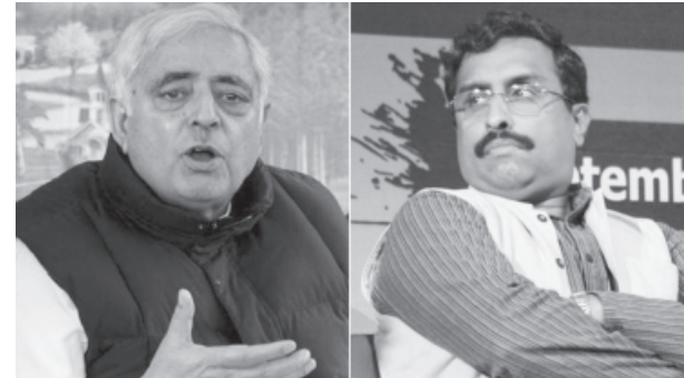
અમારા કોર એજન્ડામાં ચોક્કસ મુદ્દા રહેલા છે અને એવી ખાતરી ગઠબંધન ભાગીદાર દ્વારા આને સ્વીકારવામાં આવશે. જે કોઈ પણ

યકાસણી : રાજ્યપાલ દ્વારા બંનેને આમંત્રણ અપાયું છે : પીડીપી દ્વારા કમલ ૩૭૦ અંગે ખાતરીની માંગ પાર્ટી હશે તેને અમારા મુદ્દા સ્વીકારવા પડશે. જમ્મુ કાશ્મીરને પાસ દરજ્જો આપવાની જોગવાઈ ધરાવનાર કલમ ૩૭૦ને લઈને તેમની પાર્ટીનું વલણ બિલકુલ સ્પષ્ટ છે. તેમણે એમ પણ કહ્યું હતું કે, તેમની પાર્ટી રાજ્યમાંથી એએફએસપીએને લઈને પણ સ્પષ્ટ વલણ ધરાવે છે. ૨૫ બેઠકો જીતનાર ભાજપને પણ રાજ્યપાલ વોરા દ્વારા અલગ ચર્ચા માટે બોલાવવામાં આવ્યા છે. પહેલી જાન્યુઆરી સુધી સરકારની રચનાને