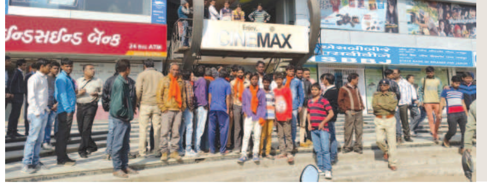
ગાંધીનગર શહેરમાં સિને મેક્સ પાસે પોલીસ બંદોબસ્ત મુકવામાં આવ્યો હતો.

ગાંધીનગર શહેરમાં સ્થિત સિને મેક્સ તથા આર વર્લ્ડ ઉપરાંત ગાંધીનગર-કોબા હાઈવે પર સ્થિત સિટી પલ્સ થિયેટરમાં વીએચપી કાર્યકરો પહોંચી ગયા હતા અને ફિલ્મ બંધ કરાવી દઈ તે ફિલ્મના તાત્કાલિક ધોરણે બોર્ડ હટાવાઈ દીધા હતાં. સવારથી જ આ મામલાને લઈ વિવિધ થિયેટર બહાર પોલીસ બંદોબસ્ત ગોઠવી દેવામાં આવ્યો હતો. જો કે તોડફોડ કરીને વિરોધ વ્યક્ત ન કરતા થિયેટર સંચાલકોએ હાશકારો અનુભવ્યો હતો.