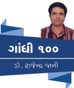
ગાંધી ૧૦૦ ડૉ. રાજેન્દ્ર ગાંધી

ચૂંટલા સેવક વચ્ચે પેદા થયું છે. પ્રજા અને પ્રજાના સેવક વચ્ચેનું અંતર ઘટાડવા તેમણે ઈચ્છા વ્યક્ત કરી હતી. તેમણે કહ્યું કે જબરદસ્તી કે સત્યાગ્રહના નામે આંદોલનનો આધાર લઈને આપણે 'માઈ' હુર નહીં કરી શકીએ પણ એક પ્રજા સેવક કેવો હોવો જોઈએ એ આદર્શ સમાજ સમક્ષ રાખીને શાંત આંદોલન દ્વારા સમગ્ર દેશમાં લોકમત ભીનો કરવો જોઈએ. પ્રજા અને તેના પ્રતિનિધિ વચ્ચેનું અંતર આ રીતે ઘટાડી શકાય એવો વિશ્વાસ વ્યક્ત કર્યો હતો. ગાંધીજીએ આ મુદ્દે વધુમાં વધુ આકરા શબ્દો ગણાવી શકાય તેવી રીતે સહજતાથી થોડામાં ઘણું કહ્યું હતું. ધારાસભ્ય કે મંત્રી પગાર-ભથ્થા મેળવે એ વાત તેમને ગળે ઉતરતી જ નહીં તેમ છતાં તેમણે આ મુદ્દે બહુ શાંત ચિત્તે સમગ્ર ભારતીય સમાજને સમજાવવા પ્રયાસ કર્યો હતો. ગાંધી કહે છે, 'મંત્રી અને ધારાસભ્ય પ્રજામાંથી જ હોય છે, બહારનો કાંઈ હોતો નથી. જો મંત્રી બનતા પહેલા તેની જરૂરિયાત ચપરાસીઓ (પટ્ટાવાળા - સેવાકર્મી) જેવી ન હતી તો ધારાસભ્ય કે મંત્રી બન્યા બાદ એની જરૂર કેવી રીતે પડે? ગાંધીએ એવો મત વ્યક્ત કર્યો હતો કે હું એવી ઈચ્છા વ્યક્ત કરું કે ચપરાસી મંત્રી પદનો લાયક બને અને તો પણ પોતાની જરૂરીયાતો ચપરાસી જેટલી જ રાખે !' આટલી સ્પષ્ટ વાતો પછી પણ ગાંધીએ સોય ઝાટક્યા વગર એક સરસ મજાનું વાક્ય કહ્યું છે એ આજના સમય સંદર્ભમાં પણ વાંચવા વિચારવા જેવું અને ખાસ તો પ્રજાના પ્રતિનિધિઓએ જાહેર જીવનમાં લાગુ પડવા જેવું છે. ગાંધીએ ધારાસભ્યો મંત્રીઓને ઉદ્દેશીએ કહ્યું હતું: 'દરેક મંત્રી - ધારાસભાનો સદસ્ય એટલું સમજ લે કે મંત્રી કે ધારાસભ્ય તરીકે એમને જે વેતન ભથ્થા બાંધી આપવામાં આવ્યા છે એ મુજબ વેતન-ભથ્થા લેવા માટે એ બંધાયેલો નથી.'