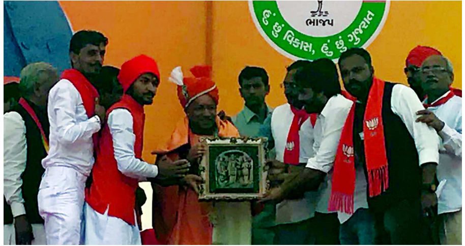
અરવલ્લી જિલ્લા કોંગ્રેસમાં ભંગાણ

કરનાર કોના દર્શન કરે છે તેવો પ્રશ્નાર્થ કર્યો હતો. ભારત માતા સાથે પડખે ઊભા રહેવાના બદલે રાહુલ ઈટલી પોતાનાં નાનીને મળવા ઊપડી ગયા હતા. ગુજરાતના વિકાસને પાગલ કહેવો એનાથી બીજું ક્યુ અપમાન ગુજરાતનું હોઈ શકે તેમ જણાવી યોગીએ કહ્યું રાહુલ ગાંધી જાણે બિચારા બેબાકળા બની ગયા છે. યોગીએ ગુજરાતના સર્વાંગી વિકાસની પ્રશંસા કરી હતી. તેમણે કહ્યું કે ગુજરાતમાં મોદીને કારણે તમામ ક્ષેત્રે આમૂલ પરિવર્તન આવ્યું છે શાંતિ-સલામતી સાથે રાજ્યમાં સુખ શાંતિ સાથે વિકાસ થયો છે. ગોધરા પછી બીજા કોઈ તોફાનો થયાં નથી. પણ રાહુલ ગાંધીને આ વિકાસ દેખાતો નથી. કારણ કે કોંગ્રેસે ક્યારેય વિકાસ કર્યો નથી.