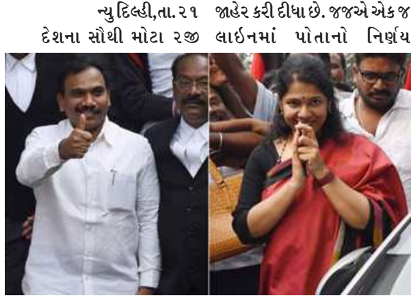
ન્યુ દિલ્હી,તા. ૨૧ જાહેર કરી દીધા છે. જજએ એક જ દેશના સૌથી મોટા ૨જી વાર્ષિકમાં પોતાનો નિર્ણય

દેશના સૌથી મોટા ૧.૭૬ હજાર કરોડના દુ-જી કૌભાંડમાં એ.રાજ, કનિમોઝી સહિત તમામને સીબીઆઈ સ્પેશ્યલ કોર્ટે નિર્દોષ જાહેર કર્યા : યુપીએ સરકાર અને મારા વિરુદ્ધ ખોટા પ્રચારનો જવાબ આજે વિપક્ષને મળ્યો : મનમોહનસિંહ