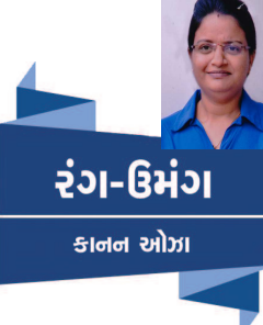
રંગ-ઉમંગ કાનન ઓગા

કબીરજી કહે છે કે : શુભ અને અશુભની એક હદ છે. માણસે બેહદમાં જવાનું છે. તો ભક્ત અખો કહે છે કે : ‘અક્ષરો બાવન છે, તેની પેલી વાર, એટલે કે શબ્દ પર થઈને આનંદ મેળવવાનો છે પરંતુ ઘણું ભણેલો માણસ પણ આમ નથી કરતો જેની પાસે જે નથી, જે તેનો સ્વભાવ નથી, તેની પાસે તેની અપેક્ષા રાખવી તે મૂર્ખતા છે અને જેનો સ્વભાવ આનંદ છે. એવા આત્માનું વિસ્મરણ થવું તે પણ મૂર્ખતા છે.’ જડ પદાર્થ પાસે આનંદ નથી પણ આત્મામાં છે. માટે જડ તરફનું વલણ ફેરવી ને આત્મા તરફનું કરવું તેને ‘વૈરાગ્ય’ કહે છે. લાખ રૂપિયાનું ઈનામ મળે તો માણસ પુશ થાય છે. એ પુશીને તે ભૂલથી આનંદ માને છે. પરંતુ પુશી તો કોઈ નિમિત્તના કારણે આવે છે. એ ઉદ્દિપક નિમિત્ત છે, એ ભ્રાંતિ સર્જે છે, કેમ કે એ રીતે મળતી પુશી પદાર્થમાંથી નહિ પણ માણસ પદાર્થ વાપરે નહિ તો પણ પુશી મેળવી શકે. પણ એવું નથી બનતું. માટે પદાર્થ ભણિક પુશી નથી આપી શકતો તો તે શાશ્વત આનંદ કેવી રીતે આપી શકો ન જ આપી શકે પદાર્થનું વળગણ ન રાખો. માણસ જન્મ્યો ત્યારે એક સૂતરનો તાંબણો પણ સાથે નહોતો લાવ્યો. અને જગતમાંથી જશે મૃત્યુ પામશે - ત્યારે પણ કશું સાથે લઈ જઈ શકશે નહિ. ત્યારે તો માણસ જે શરીરને લઈને આવ્યો હતો. તેણે પણ મૂકીને તેને જવું જ પડશે. અને તે નથી જાણતો એવી અજ્ઞાત સૃષ્ટિમાં પ્રયાણ કરવા પડશે.