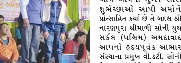
અટક બદલેલ છે

આ ૧૯માં સ્નેહમિલન સમારંભ અને અલૌકિક જય નારાયણ ભજન સંધ્યા (સરઢવ)માં સમારંભના પ્રમુખ ઉદ્દઘાટક પ્રમુખ સ્વાગત પ્રમુખ, ભજનના સહાયક દાતાઓ, બેનરના દાતા, વર્તમાન હોદ્દદારો, નારણપુરા યુથ સર્કલના પૂર્વ પ્રમુખો, સલાહકાર બોર્ડ તેમજ નારણપુરા યુથ સર્કલની સમગ્ર કમિટી અને અમદાવાદ પશ્ચિમ અને ગાંધીનગરના તમામ સભ્યો અને આમંત્રિતો અને જય નારાયણ ભજન સંધ્યા (સરઢવ)એ હાજર રહી સ્થાન શોભાવી અને ખુબજ ઉત્સાહપૂર્વક તમામ પરિવાર સાથે