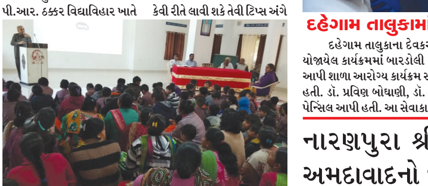
દહેગામ તાલુકામાં ગીતા જ્યંતિએ સેવાકાર્ય

શિલ્પણ અને સાહિત્ય અને સમાજનો સહજ સમન્વય ઝંખતી સંસ્થા ત્રિદલની ડિસેમ્બર માસની બેઠક તા. ૨૦ ડિસેમ્બરને રવિવારના રોજ સાંજે ૪.૩૦ કલાકે નમન એપાર્ટમેન્ટ પ્લોટ નં. ૭૮૦ મહારાષ્ટ્ર ભવન સામે સેક્ટર-૨૧ ખાતે મળશે. ગાંધી મિત્ર વર્તુળ સંસ્થાની માસિક બેઠક ખાસ સંજોગોમાં તા. ૩૦ ડિસેમ્બરને પાંચમા રવિવારના રોજ યોજાશે. જેની સૌ ગાંધીજન મિત્રો ભાવિકોએ નોંધ લેવાની રહેશે.