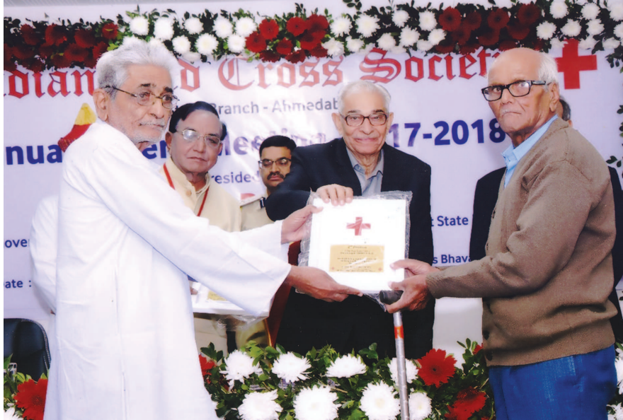
ઈન્ડિયન રેડ ક્રોસ સોસાયટી ગાંધીનગર જિલ્લા શાખાને મળેલા બે એવોર્ડ

ગાંધીનગર તા. ૨૧ શહેરના સેક્ટરોમાં ગટરો ઉભરાવાની સમસ્યાનું કાયમી નિરાકરણ આવતુ નથી. તંત્ર પાસે પણ પુરતો મેન પાવર અને મશીનરી નથી ત્યારે ગટરો ઉભરાવાની સમસ્યાને ડામવાનું કામ કપરુ બન્યુ હોવાનો રોષ જેથી ગટરોની સમસ્યા દુર કરવાના મામલે એક સાંધે ત્યાં તેર તુટે તેવી સ્થિતિ છે. આવા સંજોગોમાં શહેરમાં ગટરો ઉભરાવાની ફરિયાદો વારંવાર ઉઠતી રહે છે. તંત્ર પણ ગટરો લાઈનને યોગ્ય કરવા રોજબરોજ દોડે છે. પરંતુ કાયમી નિરાકરણ આવે