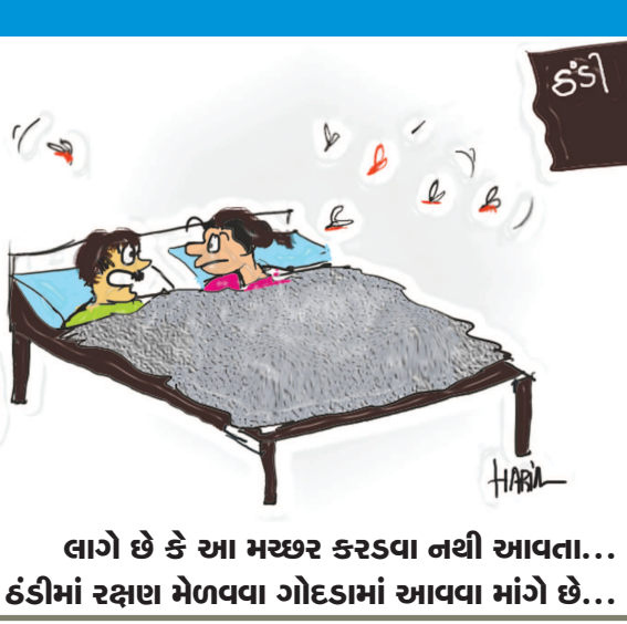
લાગે છે કે આ મચ્છર કરડવા નથી આવતા... ઠંડીમાં રક્ષણ મેળવવા ગોઠડામાં આવવા માંગે છે...