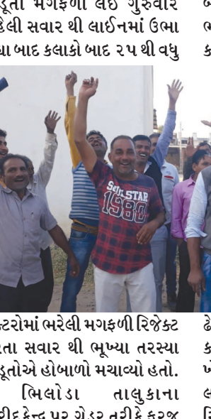
ખેડૂતો મગફળી લઈ ગુરુવારે વહેલી સવાર થી લાઈનમાં ઉભા રહ્યા બાદ કલાકો બાદ ૨૫ થી વધુ

રાજ્ય સરકારે ટેકાના ભાવે ખરીદ કેન્દ્રો પર મગફળીની ખરીદી પ્રક્રિયામાં ખુબ જ સાવચેતી રાખી રહી છે ગત વર્ષના મગફળી ખરીદ કેન્દ્રો પર થયેલા કોભાંડ માં ઠાણેલી સરકાર ૧૫ ડિસેમ્બર થી શરૂ કરેલ ખરીદીમાં ગોલમાલ ન થાય તે માટે ચીવટ પૂર્વક ખરીદી કરી રહી છે જેના લીધે ખેડૂતોને ભારે રંજાડ નો સામનો કરવો પડી રહ્યો છે એકબાજુ ખરીદ પ્રક્રિયા ધીમી હોવાની સાથે ખેડૂતોની મગફળી નો પાક એનકેન પ્રકારે રિજેક્ટ કરવામાં આવે તેને ડોવાની ખેડૂતોની ભૂમો ઉઠી રહી છે અરવલ્લી જિલ્લાના મિલોડા ટેકાના ભાવે ખરીદ કેન્દ્ર પર આંતરિક નોંઘણી કરાવેલ