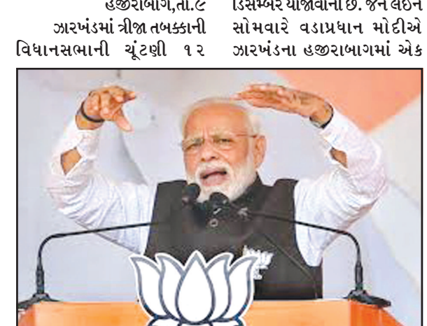
હજીરાબાગ, તા. ૯ અરખંડમાં ત્રીજા તબક્કાની વિધાનસભાની ચૂંટણી ૧૨ ડિસેમ્બરે યોજાવાની છે. જેને લઈને સોમવારે વડાપ્રધાન મોદીએ અરખંડના હજીરાબાગમાં એક જાહેર સભા સંબોધિત કરી હતી. વડાપ્રધાન નરેન્દ્ર મોદીએ અરખંડના બરહીમાં ચૂંટણી સભાને સંબોધન કર્યું હતું. આ દરમિયાન વડાપ્રધાન મોદીએ કહ્યું હતું કે, આ ભૂમીએ ભગવાન બિરસા મુંડાથી લઈને જય પ્રકાશ નારાયણ અને અટલ બિહારી વાજપેયી સહિત અનેક રાષ્ટ્ર નાયકોની તપસ્યાને શક્તિ આપી છે. ડૉ.શ્યામા પ્રસાદ મુખર્જીએ જમ્મુ-કાશ્મીરમાં અલગ પ્રધાન, અલગ સંવિધાન નાબૂદ માટે સંઘર્ષ કર્યાં. મને ખુશી છે કે, તેમની ભાવના પ્રમાણે જમ્મુ-કાશ્મીરમાં ભારતીય સંવિધાન સંપૂર્ણ પણે અમલમાં આવ્યું છે. તેમણે કહ્યું કે, આજે આટલી વિશાળ જનમેદની, ઝારખંડની જનતાનો મૂડ બતાવી રહી છે. અહીંયાના લોકોના હૃદયમાં વિકાસ માટે કેટલો વિશ્વાસ છે, એ આજે હું આ વિશાળ જનમેદનીમાં જોઈ રહ્યો છું. હું ઝારખંડમાં જ્યાં પણ જાઉં છું, ત્યાંની સભા જૂની સભાઓના રેકોર્ડ તોડી રહી છે. વડાપ્રધાન મોદીએ કહ્યું કે, આજે સમગ્ર દુનિયામાં હિન્દુસ્તાનનો ડંકો વાગી રહ્યો છે. અમેરિકા, ઈંગ્લેન્ડ, કેનેડા,

ત્રિશંકુ પરિણામ આવશે તો કર્ણાટકની જેમ વિનાશ કરનારા લોકો મેદાનમાં આવશે