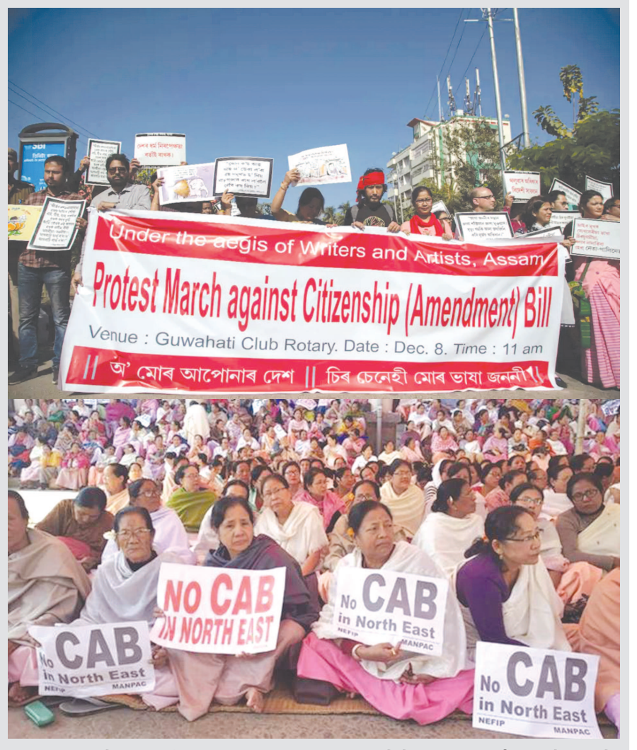
ઉગ્ર આક્રોશ - નાગરિકતા સુધારા બિલ રજૂ થવાની સાથે દેશના ઉત્તર-પૂર્વીય રાજ્યોમાં ભારે વિરોધ - વંદોળ જાગ્યો હતો... ગૌવાટી, સિલોંગ સહિતના પૂર્વીય શહેરોમાં ધરણા, ઉપવાસ અને રેલી જેવા કાર્યક્રમો યોજાયા હતા. જ્યારે દિલ્હી ખાતે પણ વિરોધપક્ષોએ પણ સંસદ ભવન પાસે ટેબાવો કર્યા હતા. અને પૂર્વીય રાજ્યોના નાગરિકોએ પણ દિલ્હીમાં ધરણાના કાર્યક્રમો યોજ્યા હતા...