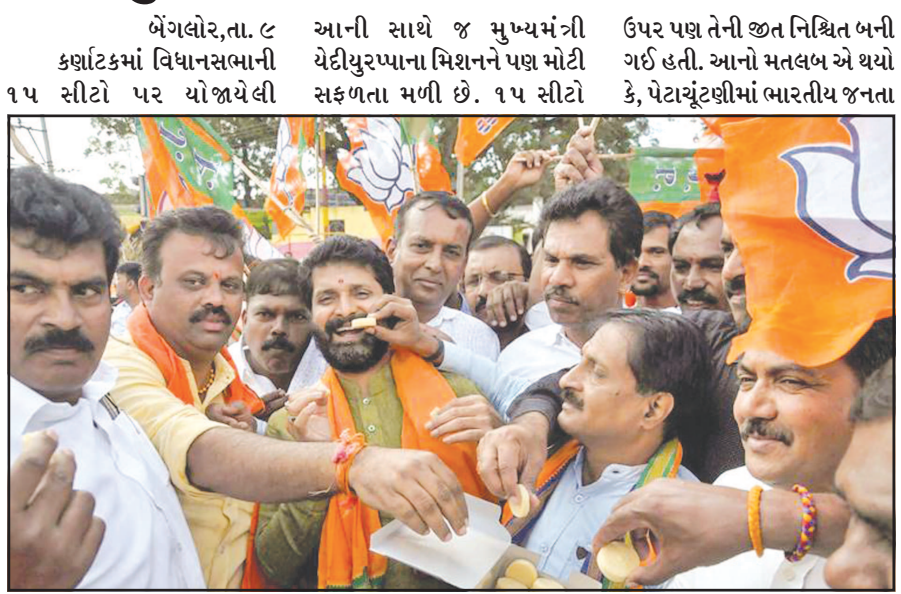
પેટાચૂંટણીમાં ભારતીય જનતા પાર્ટીએ જોરદાર સપાટો બોલાવી દીધો છે. કિલન સ્વિપના કારણે જો પાર્ટીને ભવ્ય જીત થઈ છે.

ભાજપે ૧૫ પૈકીની ૧૨ સીટો ઉપર ભવ્ય જીત મેળવી : પેટાચૂંટણીમાં ભવ્ય વિજય થતાં ચેદીચુરપ્પા સરકાર હવે બહુમતિમાં : કોંગ્રેસને મોટો ફટકો પડ્યો : બે બેઠકો મળી : ૧૨ બેઠક કોંગ્રેસ પાર્ટીએ ગુમાવી દીધી