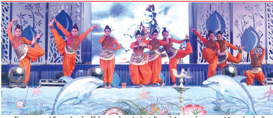
હિલવૂડ સ્કૂલ, ગાંધીનગરનો ૯મો વાર્ષિકોત્સવ તાજેતરમાં 'વોટર' થીમ સાથે ઉત્સાહપૂર્ણ વાતાવરણમાં ઉજવાયો હતો. ગીત, સંગીત, નૃત્ય અને નાટ્યનો અનોખો સંગમ શાળા પરિસરમાં યોજાયેલા આ વાર્ષિકોત્સવમાં જોવા મળ્યો હતો. આ પ્રસંગે મુખ્ય અતિથિ

જન્મદિને વધામણી વિભાગ અંતર્ગત કોઈપણ વાચક પોતાની તસવીરો પ્રકાશન માટે મોકલી શકે છે. પરંતુ, વાચકોને વિનંતી છે કે મોકામાં મોકી આ તસવીરો જન્મદિવસ દોરે તો ના અગાઉના દિવસે એક વાગ્યા સુધીમાં અખબારને મળી જાય. વાચકો ઈચ્છે તો આ વિભાગમાં પ્રકાશન હેતુ પોતાની તસવીરો અગાઉથી પણ મોકલાવી શકે છે. - સંપાદક