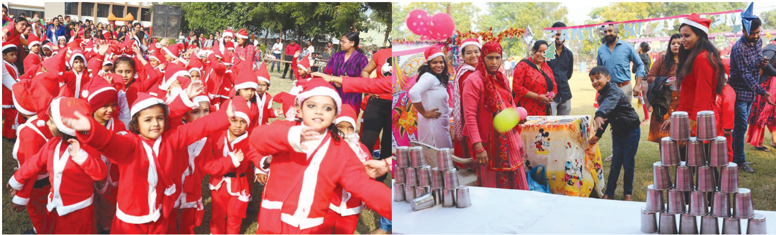
ઈન્ટરનેશનલ સ્કૂલ અને રંગોલી પ્રિસ્કૂલનાં વિવિધ સેન્ટર્સના શિક્ષકો અને વિદ્યાર્થીઓ દ્વારા જ ઊભા અને ૧૫ ગેમ સ્ટોલ્સ આ કાર્નિવલનું શાળામાં વિદ્યાર્થીઓ માટે યલાવવામાં આવતા અન્ટર પ્રેન્ટિસીપ પ્રોગ્રામ અંતર્ગત ધોરણ-૫થી ૮ના ૩૨ વિદ્યાર્થીઓ દ્વારા આયોજન કરવામાં આવેલા ૧૫ ફૂડ સ્ટોલ્સ વિશેષ આકર્ષણ રહ્યા હતા.

ગાંધીનગર, તા. ૨૯ ગાંધીનગર શહેરની અગ્રગણ્ય શૈક્ષણિક સંસ્થા રંગોલી ઈન્ટરનેશનલ સ્કૂલ ખાતે નાતાલના તહેવાર નિમિત્તે પ્રતિવર્ષ ભવ્ય કાર્નિવલનું આયોજન કરવામાં આવે છે. આ કાર્નિવલમાં રંગોલી ઈન્ટરનેશનલ સ્કૂલ ઉપરાંત ગાંધીનગર જિલ્લાની તમામ રંગોલી પ્રિસ્કૂલનાં બાળકો અને વાલીઓ મોટી સંખ્યામાં ઉપસ્થિત રહે છે.