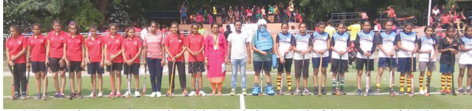
શ્રી અખિલ આંજણા કેળવણી મંડળ, ગાંધીનગર સંચાલિત શ્રી જે.એમ.ચૌધરી સાંવજનિક કન્યા વિદ્યાલય સેક્ટર ૭ ગાંધીનગરને ખેલ મહાકુંભમાં તાલુકા તથા જિલ્લા કક્ષાએ શ્રેષ્ઠ શાળા પારિતોષિક રૂા. ૨૫ હજાર તેમજ ૧,૫૦,૦૦૦નું ઇનામ પ્રાપ્ત થયું છે.