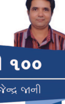
ગાંધી ૧૦૦ ડો. રાજેન્દ્ર બાની

એ શબ્દ વડે જે કંઈ સમજે છે, તેનું કંઈ સમજતા નથી, પરંતુ કંઈક જુદું જ સમજે છે. તેમને મન વર્ણવ્યવસ્થા એટલે વ્યક્તિના સ્વભાવ અનુસાર, અર્થાત વ્યક્તિની વંશપરંપરાગત અને અભ્યાસથી પ્રાપ્ત કરેલી કળતા અનુસાર શ્રમવિભાગ, અને કામકાજની વહેંચણી. તે કઈ ઉચ્ચનીય ભાવવાળા વર્ગો કે વર્ગોને અર્થ નથી સ્વીકારતા. પરંતુ સાથે સાથે તે એમ પણ નથી માનતા કે, વર્ગીયન એ આ શ્રમજીવી સમાજ મેટા કે કેન્દ્રિત યંત્રધોગની આસપાસ રચાયો જોઈએ. વૈયક્તિક રીતે જેનું નિયંત્રણ થાય છે તે મોટો કેન્દ્રિત યંત્રધોગ અનેકોનું શોષણ ઉભું કરે છે, એ વાતને સાબિતીની જરૂર નથી. એ વસ્તુ આજે પણ તરફ મોજૂદ છે, તથા તે મૂડીવાદને નામે ઓળખાય છે. આજે આખી દુનિયામાં જોવા મળતાં તથા આંતર- આંતર- આંતરવાર્ગીય અદભૂત અને ને મોટે ભાગે તેણે જ ઊભો કરે છે. જોકે એમ માનવામાં આવે છે કે, મોટા કેન્દ્રિત યંત્રધોગ અને વેપાર ઉપર વૈયક્તિક નહીં પશુ પ્રબળતા માલકી અને નિયંત્રણ હોય છે. તે શોષણ જેવું કાંઈ ન રહે. પરંતુ એ ખાલતે આપણને જે કાંઈ અનુભવ છે - આપણો તે અનુભવ એ રશિયા પૂરતી