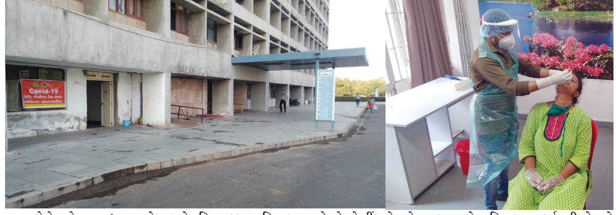
કોરોનાનો વ્યાપ વધતા આરોગ્ય અને પરિવાર કલ્યાણ વિભાગ દ્વારા ઠેર ઠેર ટેસ્ટીંગ સેન્ટરો શરૂ કરાયા છે. સચિવાલયના કર્મચારીઓ અને અધિકારીઓના લાભાર્થે સચિવાલય ફિટનેસ સેન્ટર ખાતે કોરોના એન્ટીજન ટેસ્ટ સેન્ટરનો પ્રારંભ કરવામાં આવ્યો છે.

વર્કસની માહિતી એકત્ર કરવામાં આવી છે. બીજા તબક્કામાં ફન્ટલાઈન વર્કર જેવા કે હોમગાર્ડસ, પોલીસ, સફાઈકર્મી વિગેરેને આવરી લેવાનું આયોજન કરવામાં આવ્યું છે. કેન્દ્ર સરકારની સૂચના મુજબ બીજા વિભાગના ફન્ટ લાઈન વર્કરોની માહિતી તૈયાર કરવા કમિટિની રચના કરવા જણાવાયું છે. ૫૦ વર્ષથી વધુ ઉંમર ધરાવતા સીનીયર સીટીઝનની માહિતી પણ તૈયાર કરવા માટે સૂચના આપી દેવામાં આવી છે. કોવિડ વેક્સિન અને લાભાર્થીના ચેકીંગ માટે ભારત સરકાર દ્વારા કોવિન સોફ્ટવેર બનાવવામાં આવ્યું છે. જિલ્લા અને કોર્પોરેશન દ્વારા પણ આ સોફ્ટવેરમાં રસીકરણના સ્થળ અને વેક્સિનેટરની માહિતીની એન્ટ્રી શરૂ કરી દેવામાં આવી છે. નાયબ મુખ્યમંત્રીએ ઉમેર્યું કે રસીકરણની કામગીરી માટે રાજ્યમાં ૪૭૭૯ વેક્સિનેશન સેન્ટર નક્કી કરવામાં આવ્યા છે. આ માટે ૧૫૫૩૪ ટીમો તૈનાત કરવામાં આવશે. ભારત સરકારની ગાઈડલાઈન મુજબ રસી આપવા માટે તમામ આરોગ્ય કર્મીઓને જરૂરીયાત મુજબ તાલીમબદ્ધ કરાશે. જે નાગરિકોને રસી આપવાની થશે તેમને અગાઉથી એસ.એમ.એસ. દ્વારા જાણ કરી સ્થળ-સમય-તારીખની રાજ્ય સરકાર દ્વારા સામેથી જાણ કરાશે.