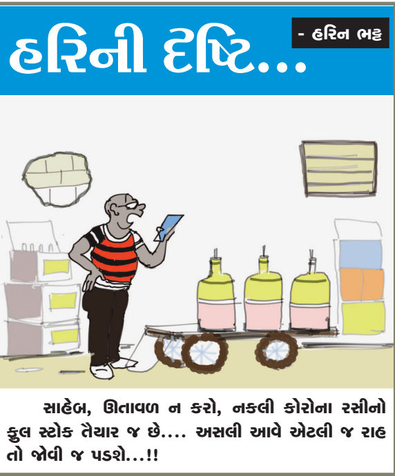
સાહેબ, ઊતાવળ ન કરો, નક્કી કોરોના રસીનો ફુલ સ્ટોક તૈયાર જ છે... અસલી આવે એટલી જ રાહ તો જોવી જ પડશે...!!