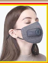
માસ્ક પહેરો... સ્વસ્થ રહો...