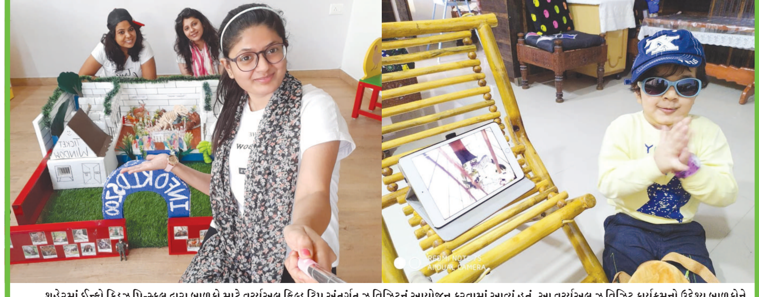
શહેરમાં ઈન્કો કિડ્ઝ પ્રિ-સ્કૂલ દ્વારા બાળકો માટે વર્ચ્યુઅલ કિલ્લ દ્વિપ અંતર્ગત જૂ વિઝિટનું આયોજન કરવામાં આવ્યું હતું. આ વર્ચ્યુઅલ જૂ વિઝિટ કાર્યક્રમનો ઉદ્દેશ બાળકોને પ્રાણીઓ વિશે જ્ઞાન મળે અને ભણતર અટકે નહીં તે હતો. શાળાના બાળકો અને તેમના માતાપિતા તમામએ આ વર્ચ્યુઅલ જૂ વિઝિટમાં ઉસ્સાહભરે ભાગ લીધો હતો.