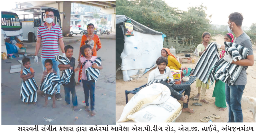
સરસ્વતી સંગીત કલાસ દ્વારા શહેરમાં આવેલા એસ.પી.ડી. રોડ, એસ.જી. હાઈવે, અંધજનમંડળ વસ્ત્રાપુર, જનતાકોસીંગ ઘાટલોડિયા તેમજ વાસણા જેવા વિસ્તારોમાં આવેલા ફૂટપાથ ઉપર પોતાનું જીવનનિર્વાહ કરતાં પરિવારોને ૧૦૦૦ ગરમ ધાબળા વિતરણ કરવામાં આવ્યું હતું.

અન્ય કમીટી સભ્યોનાં સહકાર થી ઓનલાઈન સેમિનાર સફળતા પુર્વક પૂર્ણ થયેલ અને બહોળી સંખ્યામાં વિદ્યાર્થીઓએ તેનો લાભ લીધો હતો.