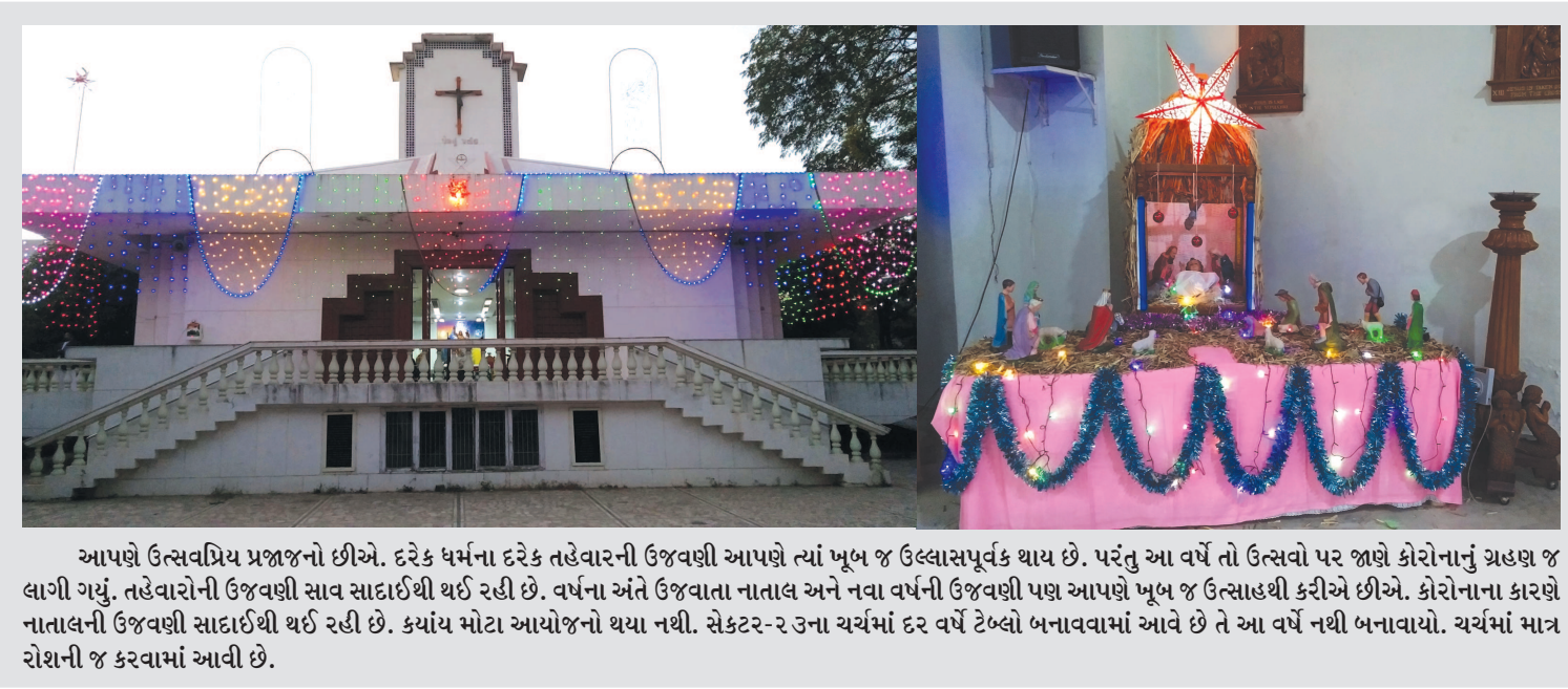
આપણે ઉત્સવપ્રિય પ્રજાજનો છીએ. દરેક ધર્મના દરેક તહેવારની ઉજવણી આપણે ત્યાં ખૂબ જ ઉલ્લાસપૂર્વક થાય છે. પરંતુ આ વર્ષે તો ઉત્સવો પર જાણે કોરોનાનું ગ્રહણ જ લાગી ગયું. તહેવારોની ઉજવણી સાવ સાદાઈથી થઈ રહી છે. વર્ષના અંતે ઉજવાતા નાતાલ અને નવા વર્ષની ઉજવણી પણ આપણે ખૂબ જ ઉલ્લાસથી કરીએ છીએ. કોરોનાના કારણે નાતાલની ઉજવણી સાદાઈથી થઈ રહી છે. ક્યાંય મોટા આયોજનો થયા નથી. સેક્ટર-૨ના ચર્ચમાં દર વર્ષે ટેબલો બનાવવામાં આવે છે તે આ વર્ષે નથી બનાવાયો. ચર્ચમાં માત્ર રોશની જ કરવામાં આવી છે.