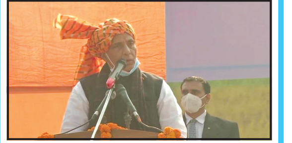
ન્યુ દિલ્હી, તા. ૨૫

જો કાયદાકારક સાબિત નહિ થાય તો સંશોધન કરવા તૈયાર