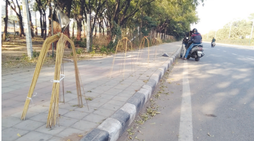
ઉત્તરાયણના આગમનના અંધાણ રૂપે આકાશમાં છૂટાછવાયા પતંગ ચઢતા નજરે જોવા મળી રહ્યા છે. શાળાઓ બંધ હોવાથી બાળકો મૂળ જ આનંદપૂર્વક સમય પસાર કરવા પતંગ ચઢાવે છે. પતંગોથી આકાશ ઘેરાય અને દોરી વડે ઈજા થાય તે પહેલા વાહનો પર સેફ્ટીગાર્ડ લગાવવાનું શરૂ થઈ ચુક્યું છે. મુખ્ય માર્ગોની આસપાસ આવા સેફ્ટીગાર્ડ લગાવવાવાળા જોવા મળી રહ્યા છે.

ટકા સીટો ભરાઈ ગઈ છે. માત્ર ભારતના જ નહીં વિદેશના વિદ્યાર્થીઓ પણ આયુર્વેદ ભણવા ગુજરાત આવી રહ્યા છે. બીજીતરફ નીટની પરીક્ષામાં જે વિદ્યાર્થીઓને ૭૨૦માંથી ૫૬૦ ગુણ આવ્યા હોય જેઓને અસાનીથી મેડિકલ સેલ્ફ ફાયનાન્સ અને ૩-૪લમાં એડમિશન મળી શકે તેવા વિદ્યાર્થીઓએ પણ આયુર્વેદમાં પ્રવેશ મેળવ્યો છે. મહત્વનું છે કે, આપણા દેશમાં ઋષિમુનિઓના કાળથી આયુર્વેદનું મહત્વ છે. પણ કોરોનામાં સારવાર માટેની દવા ઉપલબ્ધ નથી તેવા સમયે લોકોમાં રોગ પ્રતિકારક શક્તિ વધારવામાં પણ આયુર્વેદિક પદ્ધતિ મૂળ ઉપયોગી સાબિત થઈ.