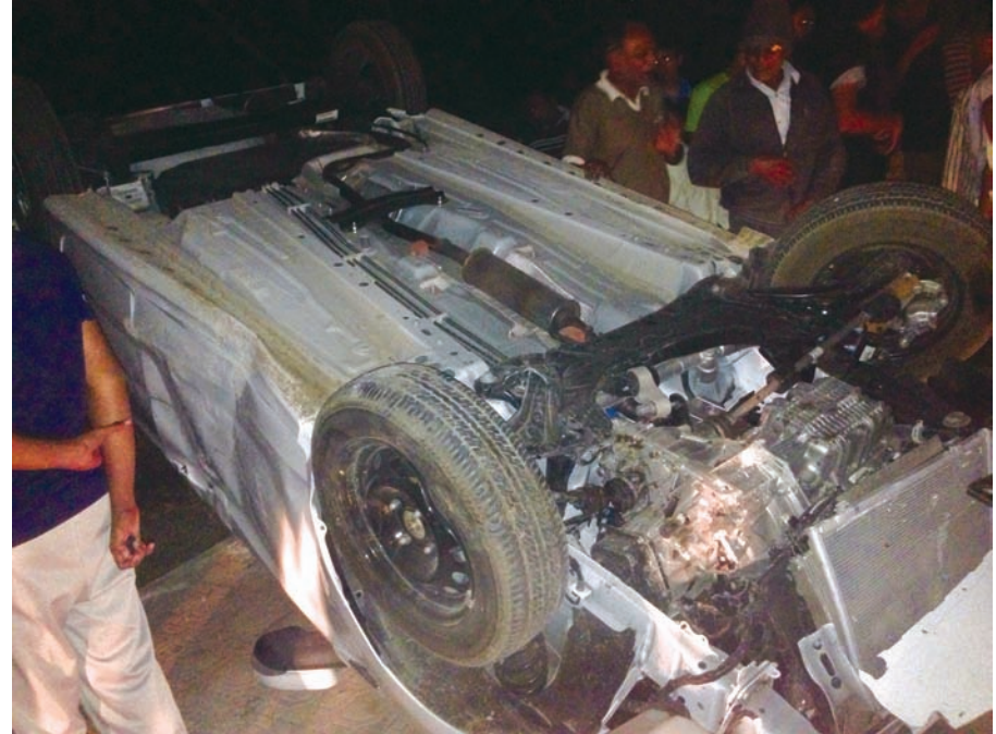
શહેરના ઘ-૧ થી ગ-૧ તરફ જતી ફોર્ડ ફીગો કારે પલટી મારી