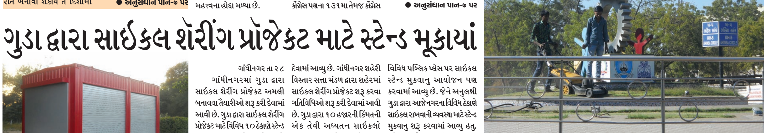
શહેરનાં સર્કલ્સની વારાફરથી મરામત થતી જ રહે છે. કોઈ ને કોઈ કારણોસર સર્કલ્સ તૂટતાં જાય છે અને ક્યારેક ખરાબ લાગે એવી સ્થિતિ નિર્માણ પામે છે. જન ફરિયાદોના પગલે સર્કલ્સની મરામત વિલંબથી પણ થાય છે. પ્રસ્તુત તસવીરમાં ખ-પ સર્કલની મરામત થઈ રહી છે.

અને પશુપાલકોના મિત્ર બની તમામ સાથે જિલ્લા પંચાયતનો સૂચારૂ સભ્યો અર્થતંત્રને વધુ મજબૂત કેવી વહીવટ અને સુશાસન આપવાનો રીતે બનાવી શકાય તે દિશામાં