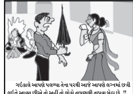
ગઈકાલે આપણે પલળ્યા તેના પરથી આજે આપણે લગનમાં છત્રી લઈને આવ્યા છીએ તો હોદ્દો તો લોકો તાપણથી તાપવા બેઠા છે...!!