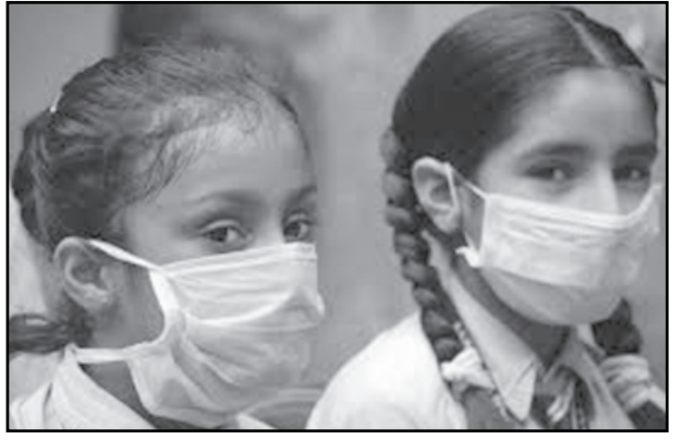
આ રોગની બીકે દર્દીઓથી પામી છે.

(સમીર બલોચ) મોડાસા, તા. ૧૮ સ્વાઈન ફ્લુ નામના રોગથી અત્યારે ગુજરાતની પ્રજા થરથર કાપી રહી છે ત્યારે આ રોગ થમવાની જગ્યાએ દિવસે ને દિવસે આ રોગના દર્દીઓની સંખ્યામાં વધારો થતો જાય છે. જયારે આ રોગને લઈને દિવસે ને દિવસે મૃત્યુઆંક પણ વધતો જાય છે. સમગ્ર ગુજરાત રાજ્યમાં આ રોગના પગલે આરોગ્ય વિભાગ રજાના દિવસે પણ કામગીરીમાં જોતારે યેલુ છે. ત્યારે આ રોગ થમવાનું નામ જ નથી લેતો ત્યારે અરવલ્લી જિલ્લામાં પણ આ રોગના સર્કલમાં આવવામાંથી બાકાત નથી રહ્યો. આ રોગે અરવલ્લી જિલ્લાને પણ ભરડામાં લીધો છે. અત્યાર સુધીમાં અરવલ્લી જિલ્લામાં આ રોગના સર્કલમાં કુલ ૨૪ વ્યક્તિઓ આવી હતી. પરંતુ આજે ૪ કેસ નોંધાતા અરવલ્લી જિલ્લામાં આ રોગના દર્દીઓની સંખ્યા વધીને ૨૮ પર આંક પહોંચ્યો છે ત્યારે આ રોગને લઈને અત્યાર સુધીમાં મૃત્યુઆંક ત્રણ ઉપર પહોંચ્યો છે. ત્યારે આજે અરવલ્લી જિલ્લાના મોડાસામાંથી બે જેટલા પોઝેટીવ કેસો મળી આવ્યા હતા. જયારે બાયડમાંથી ૧ કેસ અને માલપુરમાંથી ૧ કેસ મળી આવ્યો હતો. દિન પ્રતીદિન આ રોગ વધતો જાય છે ત્યારે આ રોગને લઈને અરવલ્લી જિલ્લાની પ્રજામાં ભયનો માહોલ સર્જાયો છે ત્યારે આ ભયાનક રોગને પગલે વાલીઓમાં ચિંતાનું મોજુ ફરી વળ્યું છે. હાલ વાલીઓ ધવાર પોતાના બાળકને પણ સ્કુલમાં મોકલવાનું ટાળવા માં આવે છે ત્યારે આ રોગને લઈને હાલ ખાનગી ઓસ્પીટલોના રોકેટરોને ઘી કેળા ધવાર તગડી ફી વસુલવામાં આવતી હોવાની ભુમ પણ ઉઠવા