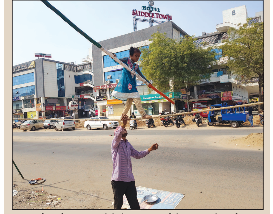
આજીવિકા માટે કરતબ - નાનકડી દીકરી દ્વારા અવનવા શારિરીક કરતબ કરાવી આજીવિકા રળતા બાપ-દીકરીની તસવીરમાં પિતાનું વાસ્તવ્ય છલછલો ભરેલું દેશ્યમાન થાય છે... દીકરીનું બાપ પરત્વેનું કતવ્ય સ્પર્શે છે... બાપ-દીકરીની આ નાનકડી તસવીર જીવનના મોટા મોટા સંબંધોને નાના કરી નાખે છે...