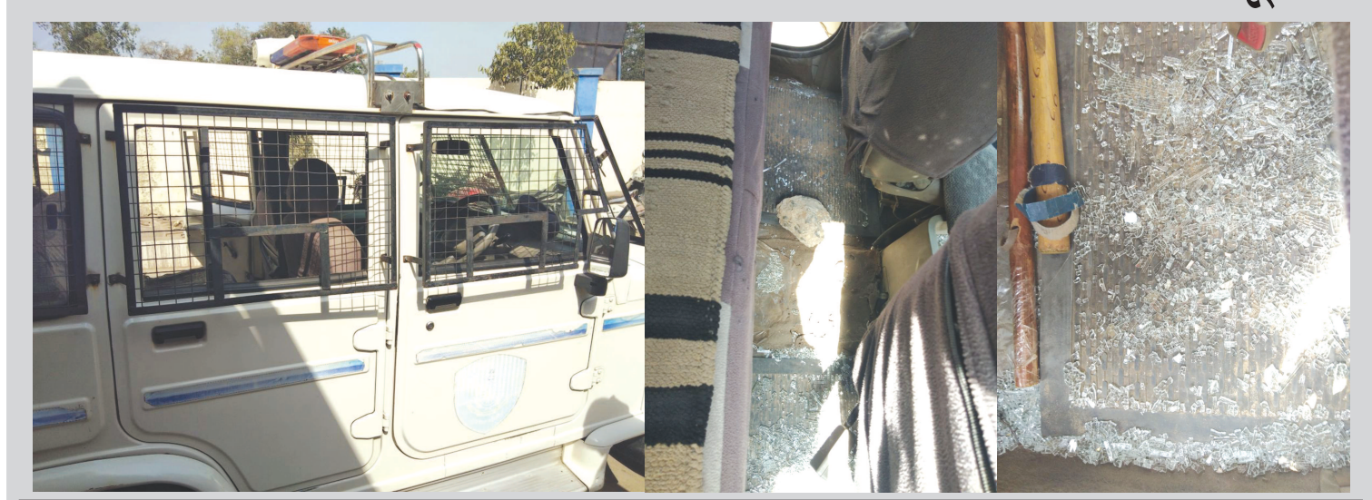
પોલીસની ગાડીમાં તોડફોડ કરીને એક હેડ કોન્સ્ટેબલને ટોળામાં ખેંચી જઈ ઘોઠા અને છુટી કાચની બોટલો મારી : ટોળા સામે ગુનો દાખલ

કલોલ તાલુકાના છત્રાલ ગામમાં ગઈકાલે બે કોમ વચ્ચે હિંસા ફાટે તેવી સ્થિતિ ઉભી થઈ હતી. એક કોમ દ્વારા બીજા કોમના સભ્યોના ઘર ઉપર પથ્થરો ફેંકાઈ રહ્યા હતા. આ મેસેજથી પોલીસ કાફલો ઘટનાસ્થળે મામલો શાંત કરાવવા પહોંચ્યો હતો. તે દરમિયાન એક કોમના ટોળાએ પોલીસની ગાડી ઉપર પથ્થરમારો કરી તોડફોડ કર્યા બાદ એક હેડ કોન્સ્ટેબલને ટોળામાં ખેંચી લઈ ઘોઠા અને છુટી કાચની બોટલો મારી હૂમલો કર્યો હતો. પોલીસે ૪૦ વ્યક્તિઓના ટોળા સામે ગુનો દાખલ કરીને કાયદેસરની કાર્યવાહી હાથ ધરી છે.