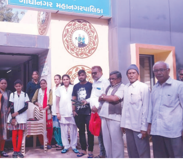
સે. રમાં નગરસેવકની અનોખી ગાંધીગીરી..!!!

ગાંધીનગર, તા. ૧૩ લાંબા સમય સુધી ચાલેલા આંદોલન પછી કેન્દ્ર સરકારે મોડે મોડે પણ સર્વર્થ વર્ગ માટે ૧૦ ટકા અનામત આપવાનું જાહેર કર્યું છે અને ગુજરાત ઈબીસીની અમલવારી કરવામાં પ્રથમ ક્રમ છે તેમ છતાં પણ તાજેતરમાં ઓએનજીસીએ બહાર પાડેલી ૭૩૭ જગ્યાઓની ભરતી માટે ઈબીસીના માટે કોટા રાખવામાં આવ્યો નથી જેથી નોકરીવાચક સર્વર્થ વર્ગના યુવાનોએ રોષ વ્યક્ત કર્યો છે. કેન્દ્ર સરકાર દ્વારા થોડા સમય અગાઉ આર્થિક રીતે નબળા સર્વર્થ વર્ગ માટે વિશેષ પ્રકારે ૧૦ ટકા અનામત નોકરી અને અભ્યાસમાં આપવાની જાહેરાત કરી છે. ગુજરાત સરકાર ઈબીસીની અમલવારી કરાવી પ્રથમ રાજ્યનો શ્રેય હુંટી રહી છે. તાજેતરમાં ઓએનજીસીમાં વિવિધ પદો માટે ૭૩૭ જેટલી જગ્યાઓ પર ભરતી બહાર પાડવામાં આવી છે પરંતુ આ ભરતી માટે કેન્દ્ર કે રાજ્ય સરકાર દ્વારા ૧૦ ટકા ઈબીસીનો કોટા રાખવામાં આવ્યો નથી. સરકાર એક તરફ ઈબીસીનો મોટો પ્રચાર કરી રહી છે પરંતુ બીજી તરફ ઓએનજીસીની ભરતીમાં કોઈ કોટા ન હોવાવાત નોકરી માટે તૈયારીઓ કરતા યુવાનોએ રોષ વ્યક્ત કર્યો છે અને ભરતીની જાહેરાત રદ કરી નવી ભરતીની જાહેરાત કોટા સાથે બહાર પાડવા માંગ કરી છે.