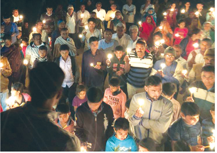
શહીદોની શહાદતને નમન કરવા માટે ભીમપુરા ગામ ખાતે શ્રદ્ધાંજલી કાર્યક્રમ યોજવામાં આવ્યો હતો, જેમાં સોસાયટીમાં વસતા આબાલવૃદ્ધ સૌકોઈ જોડાયા હતા. પેથાપુર ગામ સુધી કેન્ડલ માર્ચ પણ યોજવામાં આવી હતી અને 'શહીદો અમર રહો'ના નારા લગાવ્યા હતા.

ગાંધીનગર ની કડી સર્વ વિશ્વ વિદ્યાલય સંલગ્ન બી.પી.કોલેજ ઓફ બિઝનેસ એન્ડમીનીસ્ટ્રેશન (બી.બી.એ.) કોલેજના વિદ્યાર્થીઓ શ્રદ્ધાંજલિ કાર્યક્રમના ભાગ રૂપે પગપાળા કોલેજથી શ્રી અરવિંદ કેન્દ્ર ખાતે પહોંચ્યા જ્યાં શ્રી અરવિંદના દિવ્યાંશના સાંનિધ્યમાં વિદ્યાર્થીઓએ શહીદોને વીરાંજલી આપી હતી. સભા સ્થળે વિદ્યાર્થીઓ દ્વારા છત્રપતિ શિવાજી મહારાજની વીરરસની વાતો રજૂ કરી તેમજ કાશ્મીર સમસ્યા અને શહીદોના વિવિધ પ્રસંગો યાદ કરાયા હતા. આચાર્ય ડો. રમાકાંત પુષ્ટિ દ્વારા વિદ્યાર્થીઓને પગપાળા યાત્રા પહેલા વર્ગખંડમાં બે મિનીટના મૌન માટે આહ્વાન કરાવ્યું હતું. સમગ્ર કાર્યક્રમનું સંચાલન બીબીએ કોલેજના યુથ કાઉન્સિલના ઉત્સાહી વિદ્યાર્થીઓ દ્વારા કરવામાં આવ્યું હતું.