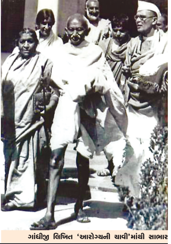
ગાંધીજી લિખિત 'આરોગ્યની યાત્રા'માંથી સાભાર