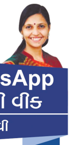
WhatsApp ઓફ ઈ વીડ નેહલ ગઢવી

ગમાયું, પછી રાત-દિવસ દીકરા-દીકરી યાદ આવવા માંડ્યાં. પાછાં ત્યાં ગયાં. અમેરિકાના સમાજશાસ્ત્રીઓએ સારું નામ શોધી કાઢ્યું છે : ખાલી થઈ ગયેલા 'માળા'નો ખાલીપો કે ખટકો. તમે લેખક, અટલે સારો શબ્દ શોધી લેજો. પણ આ 'એમટી નેસ્ટ સિન્ડ્રોમ' નો અર્થ એટલો જ છે કે દીકરા-દીકરી ચાંચાળાં-પાંખાળાં થાય અને ઊંડી જાય પછી માળામાં - ઘરમાં માળાપાને ખાલીપણાની લાગણી સત્યા કરે છે.' 'મને લાગે છે કે આનો કંઈ ઈલાજ નથી. તમે શું માનો છો? આજના જમાના દીકરા બધા ભેગા મળી સંયુક્ત કુટુંબમાં રહે, માબાપની સાથે રહે, એ શક્ય નથી લાગતું. એવડાં મોટાં ઘર ક્યાંથી કાઢો? કદાચ ઘર મળી જાય તોય એવડા મોટા મન ક્યાંથી કાઢો? એ જમાતો તો ગયો. હવે એ શક્ય જ નથી. અને એક રીતે જુઓ તો મારા જેવા વૃદ્ધોએ જરા વિચારવા જેવું છે કે દીકરાઓને તેમનું પોતાનું જીવન ન હોય? તેમણે સ્વતંત્ર રીતે ચીવવું છે. તેમની પત્નીઓ જૂની કોર્ટબિક મર્યાદાઓની બહાર રહીને આઝાદીથી જીવવા માગે છે. મને લાગે છે કે અમારાં જેવાં માબાપોએ દીકરા-દીકરીનો આવો મોહ હવે છોડવો જોઈએ. દીકરાઓને મા-બાપનો આર્થિક ભાર ઉપાડવામાં વાંધો