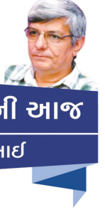
અતિતની આજ ડો. હરિ દેસાઈ

કોંગ્રેસ-રાષ્ટ્રવાદી ચિંતામાં દિલ્હીમાં ઠાકરે પિતા-પુત્ર ગુઢમંત્રી અમિત શાહ અને માર્ગદર્શક મંગળમાં સામેલ ભાજપી નેતા હાલકુશ આડવાણીને પણ મળ્યા એ વાતને ઝાડું મહત્વ અપાવાને બદલે કોંગ્રેસ અને રાષ્ટ્રવાદીની નીતિથી વિરુદ્ધ નાગરિકતા સુધારા ધારા (સીએએ), રાષ્ટ્રીય નાગરિકતા નોંધણીપત્રક (એનસીઆર) તથા રાષ્ટ્રીય વસ્તી નોંધણીપત્રક (એનપીઆર) અંગે વડાપ્રધાન મોદી અને મુખ્યમંત્રી ઠાકરે સંમત હોવાની વાત ખૂબ ગજવવામાં આવી. આ મુદ્દે ઠાકરે કરતાં કોંગ્રેસ અને રાષ્ટ્રવાદી અલગ મત ધરાવે છે. આશ્ચર્ય એ વાતનું છે કે પવારના પરિવારના 'સડાળા' અખબારસમૂહમાં ઠાકરે કોંગ્રેસ અને રાષ્ટ્રવાદીની ભૂમિકાથી વિરોધી ભૂમિકા લઈ રહ્યાની વાત ખૂબ સ્પષ્ટ કરાઈ