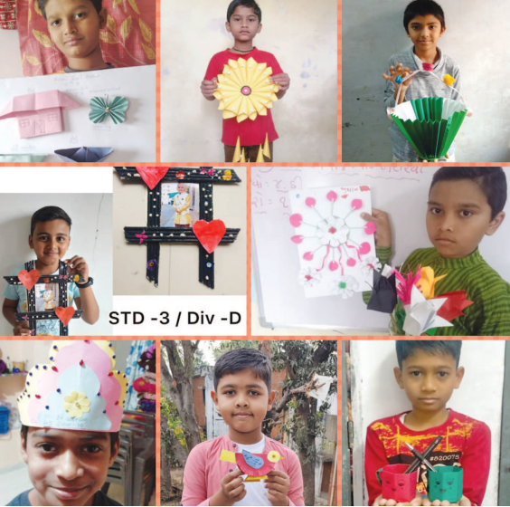
જે.બી. પ્રાથમિક શાળાના ધો-૩ થી ૫ના વિદ્યાર્થીઓ માટે રંગીન કાગળોમાંથી વિવિધ ડિઝાઈન બનાવવાની ઓનલાઈન સ્પર્ધા યોજાઈ હતી. જેમાં કુલ ૬૦ વિદ્યાર્થીઓએ ઉત્સાહપૂર્વક ભાગ લઈ રંગીન કાગળોનો ઉપયોગ કરી વિવિધ આકારો અને ડિઝાઈન બનાવી હતી.