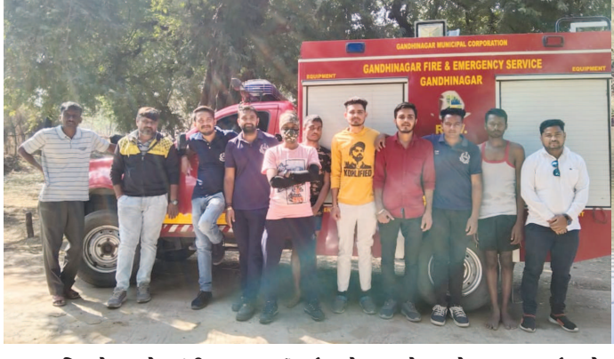
રવિવારે સવારે ગાંધીનગર તાલુકાના સોનીપુર ગામના તળાવમાં એક નીલ ગાયનું મોટું બચ્ચું પડી ગયું હતું જે તળાવની હાલતને જોઈને પડતો પડતો જીવ બચાવવા માટે ફાયર બ્રિગેડની મદદ માટે કોલ કરવામાં આવ્યું હતું. ફાયર બ્રિગેડની ટીમે તળાવમાં પડેલી ગાયને બહાર કાઢવા માટે પામતું હતું. આ દરમિયાન ગામના કાર્યો હતા પરંતુ ડરના કારણે સતત દૂર ભાગતી હોવાથી તેને યુવાનો પૈકી એક યુવાને ગાંધીનગરમાં રેસ્કયુ કાર્ય સાથે સંકળાયેલા વોલિયન્ટર્સ ગ્રુપના સ્વયંસેવકોને મદદે બોલાવ્યાં હતાં જેમણે આવીને પરિસ્થિતિનું મૂલ્યાંકન કરતાં ફાયરબ્રિગેડની મદદ લેવાનું ઉચિત માન્યું હતું. ગાંધીનગર ફાયર બ્રિગેડની ટીમે આવીને વોલિયન્ટર્સ ગ્રુપના સ્વયંસેવકોએ મળીને બે કલાકની જહેમતના અંતે નીલગાયને તળાવની બહાર કાઢવામાં અને તેનો જીવ બચાવવામાં સફળતા પ્રાપ્ત કરી હતી. ગ્રામજનોએ વોલિયન્ટર્સ ગ્રુપના સ્વયંસેવકો અને ફાયરબ્રિગેડ કર્મીઓની પ્રસંશા કરી હતી.

ગાંધીનગર, તા. ૨૩ ગાંધીનગર તાલુકાના સોનીપુર ગામના તળાવમાં પડી ગયેલી નીલગાયને શહેરમાં સરિસુખ, પ્રાણીઓ અને પક્ષીઓ વગેરેના મુશ્કેલીના સમયે બચાવકાર્ય સાથે સંકળાયેલા વોલિયન્ટર્સ ગ્રુપના યુવા સ્વયંસેવકો અને ફાયર બ્રિગેડની ટીમની બે કલાકની સહિયારી જહેમતને અંતે સહીસલામત બહાર કાઢી અને તેનો જીવ બચાવવામાં સફળતા મેળવી હતી. અત્રે ઉલ્લેખનીય છે કે આ જ તળાવમાં થોડા સમય પૂર્વે બાવળના વૃક્ષ પર પતંગની દોરીમાં ફસાયેલા બગલાઓનું આ જ ટીમે દિલકષક રેસ્કયુ કર્યું હતું. તળાવમાં એક નીલ ગાયનું મોટું બચ્ચું પડી ગયું હતું જે તળાવની હાલતને જોઈને પડતો પડતો જીવ બચાવવા માટે ફાયર બ્રિગેડની મદદ માટે કોલ કરવામાં આવ્યું હતું. ફાયર બ્રિગેડની ટીમે તળાવમાં પડેલી ગાયને બહાર કાઢવા માટે પામતું હતું. આ દરમિયાન ગામના કાર્યો હતા પરંતુ ડરના કારણે સતત દૂર ભાગતી હોવાથી તેને યુવાનો પૈકી એક યુવાને ગાંધીનગરમાં રેસ્કયુ કાર્ય સાથે સંકળાયેલા વોલિયન્ટર્સ ગ્રુપના સ્વયંસેવકોને મદદે બોલાવ્યાં હતાં જેમણે આવીને પરિસ્થિતિનું મૂલ્યાંકન કરતાં ફાયરબ્રિગેડની મદદ લેવાનું ઉચિત માન્યું હતું. ગાંધીનગર ફાયર બ્રિગેડની ટીમે આવીને વોલિયન્ટર્સ ગ્રુપના સ્વયંસેવકોએ મળીને બે કલાકની જહેમતના અંતે નીલગાયને તળાવની બહાર કાઢવામાં અને તેનો જીવ બચાવવામાં સફળતા પ્રાપ્ત કરી હતી. ગ્રામજનોએ વોલિયન્ટર્સ ગ્રુપના સ્વયંસેવકો અને ફાયરબ્રિગેડ કર્મીઓની પ્રસંશા કરી હતી.