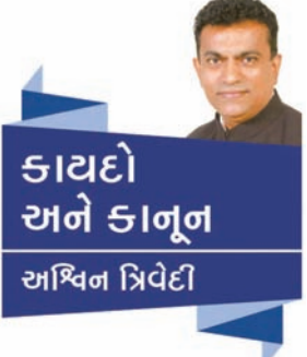
કાલ્યાણી અને કાનૂન અધિવન પ્રિવેદી

ઉપરનો વિશ્વાસ સુદ્રઢ થશે. ન્યાયપાલીકામાં પારદર્શિતાએ હાલના સમયની માંગ છે. એડવાન્સ ટેકનોલોજીનો ઉપયોગ જ્યુડીશીયલમાં કરવામાં આવશે તેમજ જરૂર જણાય તેવા કેસોમાં વિડીયો કોન્ફરન્સથી પણ આરોપીની જુબાની જલમાં બેઠા લઈ શકાય તેવી વ્યવસ્થા કરવામાં આવશે. હાલમાં જ આશારામનું એફ.એસ. જોધપુર જેલમાંથી જ ગાંધીનગરની કોર્ટના જજ મેળવી કેસની આગળની કાર્યવાહી ચાલુ કરેલ એક જ્યુડીશીયલ એકેડમી ભોપાલમાં શરૂ કરવામાં આવી છે. ફોરેન્સિક સાયન્સ યુનિવર્સિટી ગાંધીનગર ખાતે ૭૦૦ નવા ભરતી કરેલ જજોની ટ્રેનીંગ આપવામાં આવેલ ફેબ્રુઆરી ૨૦૧૬ માં જજોની બીજા બચ્ને પણ ટ્રેનીંગ આપવામાં આવશે જેથી જ્યુડીશીયલ મેજસ્ટ્રેટ પણ આધુનિક ટેકનોલોજીથી સુમાહિતગાર થઈ સમય અને ટેકનોલોજી સાથે તાલમેળ મેળવી સુદ્રઢ અને સુયોગ્ય ન્યાય પદ્ધતિથી આમ જનતાને ઝડપી અને સરળ ન્યાય અપાવી શકાશે તેમજ પોતાની જવાબદારી નક્કી થતા ન્યાયાધીશો પણ જનતાને જવાબદારીમાંથી છટકી શકશે નહીં.