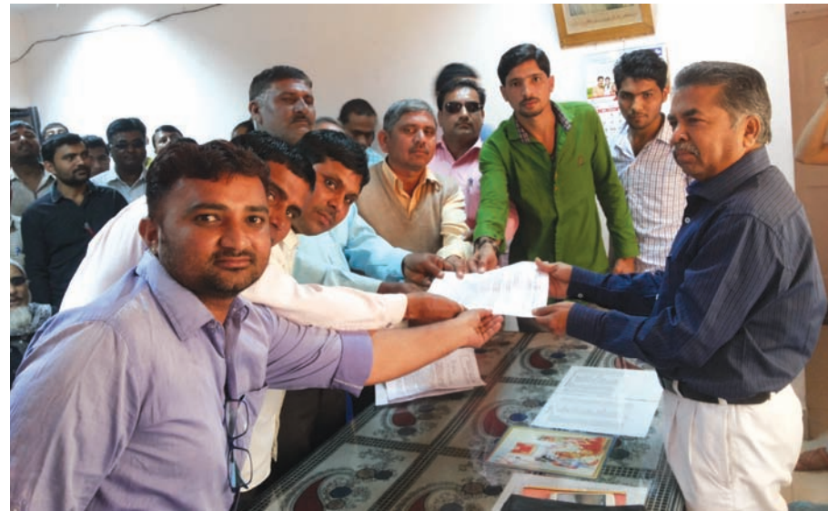
ભારત સરકાર દ્વારા દરેક શહેરો તથા ગ્રામ્ય વિસ્તારમાં એગ્રોની દુકાન ધરાવતા અને જેનું શિક્ષણ દવાઓ અને બિયારણનું વેચાણ કરતા વહેવારી પાસે બી.એસ.સી. (એગ્રી) અથવા બી.એસ.સી. કેમીસ્ટ્રી અથવા બાયો કેમીસ્ટ્રી, બાયો ટેકનોલોજી અથવા લાઈફ સાયન્સ બી.એસ.સી. (બોટની) ડિગ્રી હોવાનું ફરજિયાત કરતા મોટાભાગમાં દવાનું વેચાણ કરતા વહેવારીગણ પાસે આ ડિગ્રી ન હોવાથી આજે દિયોદર એગ્રો એસોસિએશન દ્વારા પોતાના રોજગાર-ધંધા બંધ રાખી રેલી યોજી દિયોદર મામલતદારને આવેદનપત્ર પાઠવ્યું હતું.

અને ઉલ્લેખનીય છે કે, આ કાર્યક્રમમાં રાજ્યકક્ષાના-૩, જિલ્લાકક્ષાના-૬૬, તાલુકાકક્ષાના-૪૮૬, એમ કુલ મળીને ૫૬૫ પશુપાલકોને સન્માનિત કરી ચેક તથા પ્રમાણપત્ર આપવામાં આવશે. જેમાં અંદાજે ૧૫૦૦થી વધુ પશુપાલકો ઉપસ્થિત રહેનાર છે તેમ પશુપાલન નિયામકશ્રીએ જણાવ્યું છે.