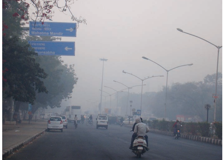
દુમ્મસથી ઘેરાયું શહેર - છલ્લા બે-ત્રણ દિવસથી વહેલી સવારથી ગાઢ ધુમ્મસ અનુભવાય છે... શાળા-કોલેજ જતા બાળકો હોય કે મોર્નિંગ વોકમાં નિકળતા વોકર્સ હોય... સૌને ગાઢ ધુમ્મસમાંથી પસાર થવું પડે છે... સૂર્યોદય બાદ ધીમે-ધીમે બે-ત્રણ કલાકે ધુમ્મસ આછું અને ઓછું થાય છે... ધુમ્મસમાં ચાલવાની મજા પણ અનેરી હોય છે... દષ્ટિ સામે ધુંધળું વાતાવરણ, પરંતુ જેમ જેમ ગતિ કરીએ તેમ તેમ માર્ગ સ્પષ્ટ બને છે... આ જ જીવનનો સંદેશ છે... આવો શહેરના શિયાળાની સવારની અનુભૂતિનો આ અવસર છે....

આપતા રાજ્યના ગૃહપ્રધાન રજની પટેલે આજે જણાવ્યું હતું કે, સરકાર જે બાબત અંગે અગાઉ કહેતી હતી કે ઈશરત એક આતંકવાદી હતી, તે બાબતને હેડલીને આપેલી જુબાનીએ સમર્થન મળ્યું છે. અગાઉના પોલીસ અધિકારી ડી જી વણઝારા ઈશરત જહાં એન્કાઉન્ટર કેસમાં લાંબો સમય જેલવાસ ભોગવી ચુકેલા છે. ઉલ્લેખનીય છે કે, ડી જી વણઝારા છ એન્કાઉન્ટર કેસમાં આરોપી છે. જે પૈકી ૧૫ જુન ૨૦૦૪માં ઈશરત જહાં અને તેની સાથેના લોકોના એન્કાઉન્ટર કેસનો પમ સમાવેશ થાય છે. અમદાવાદના કોતરપુર વોટર વર્ક્સ પાસે ગુજરાત પોલીસ દ્વારા એન્કાઉન્ટર કેસનો પણ સમાવેશ થાય છે. અમદાવાદના કોતરપુર વોટર વર્ક્સ પાસે ગુજરાત પોલીસ દ્વારા