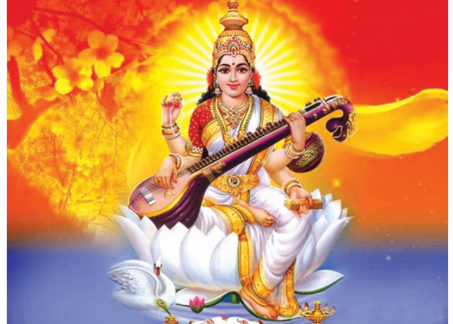
સરસ્વતી વંદના - વસંત પંચમી એટલે મા-સરસ્વતીના પૂજનનો દિવસ... ભગવાન શ્રીકૃષ્ણને મહા સુદ-પના દિવસે મા-સરસ્વતીનું પૂજન કર્યું હતું... આજે પાવન પ્રસંગે મા-સરસ્વતીના ચરણોમાં પ્રાર્થના કરીએ... આપણી વાણી શુભ અને મંગલમય બની રહી....

ધરાશાયી થઈ ગયું હતું. નિરાશાજનક વૈશ્વિક સંકેત અને કંપનીઓના ખરાબ પરિણામોના કારણે બજારને મોટો ફટકો પડ્યો છે. આજે દિવસ હતો. સેંસેક્સે ૨૪૦૦૦ની સપાટી ગુમાવી દીધી હતી. બીજી બાજુ નિફ્ટીમાં ૨૩૮ પોઈન્ટ અથવા તો ૩.૨૩ ટકાનો ઘટાડો રહેતા તેની