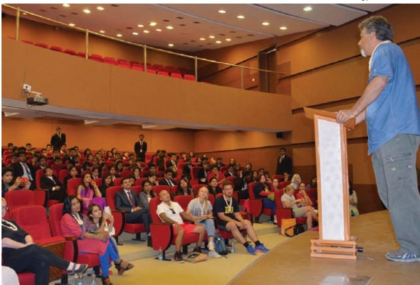
યુનાઈટેડ સ્કૂલ ઓફ લૉ, અમદાવાદના ઉપક્રમે એડીથ કોવન યુનિવર્સિટી, ઓસ્ટ્રેલિયાના ૧૨ વિદ્યાર્થીઓ અને બે અધ્યાપકોએ 'શરીંગ એક્સપિરીયન્સ વિથ ઓસ્ટ્રેલિયન સ્ટુડન્ટ્સ' કાર્યક્રમમાં ભાગ લીધો હતો. યુનાઈટેડ સ્કૂલ ઓફ લૉના ડિરેક્ટર અને સિટી સિવિલ કોર્ટના