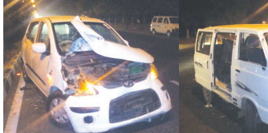
ગાંધીનગર કોબા માર્ગ પર ધોળાકુવા ગામે ગત મોડી રાત્રે આઈટેન અને માડૂતિવાન વચ્ચે અકસ્માત સર્જાયો હતો. જેમાં બન્ને કારમાં મોટાપાયે નુકશાન થવા પામ્યું હતું અને મુસાફરોને નાની-મોટી ઈજાઓ થતા ૧૦૮ મારફતે સિવિલ હોસ્પિટલ ખાતે ખસેડવામાં આવ્યા હતા.