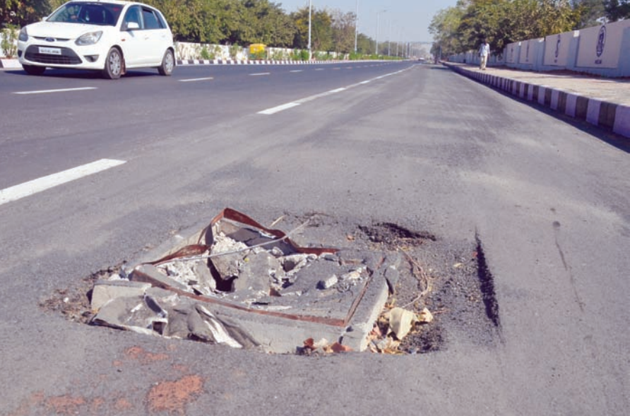
માર્ગ વચ્ચે ગટરનું ગાંધીનગર : મહાત્મા મંદિરના માર્ગ પર વચ્ચે ગટરનું ડાંકણું તુટી જતાં દિવ્યકી વાહનચાલકો તથા રાહદારીઓ ભારે હાલાકી અનુભવે છે. પાટનગરના વી.આઈ.પી. ગણાતા વિસ્તારમાં આ સ્થિતિ હોય તો અંતરીયાળ વિસ્તારની તો શું હાલત થતી હશે ?