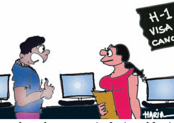
મેડમ, હવે પગાર વધારવાનું નહીં કહું... અમેરીકામાં જોન લઈ લઈશ એવું પણ નહીં કહું... સોરી...