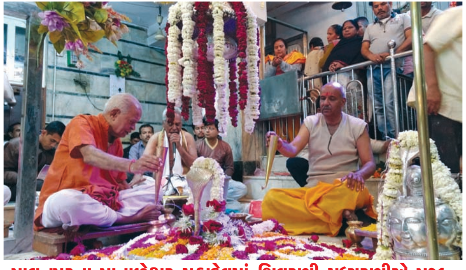
પાલનપુરના પાતાળેશ્વર મહાદેવમાં શિવરાત્રી મધ્યરાત્રીએ પૂજા