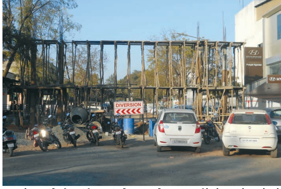
પ્રવેશ દારનું નિર્માણ - ગાંધીનગર સાંસ્કૃતિક નગર, હરિયાળા નગર તરીકે ઓળખાય છે... સાથે સાથે ઔદ્યોગિક નગર પણ છે... અહીં ઔદ્યોગિક વસાહત પણ આવેલી છે... સેક્ટર-૨૮ ખાતે આવેલ જીઆઈડીસી છેલ્લા ઘણા સમયથી ચર્ચામાં રહી હતી... ખખડપ માઈનો હોય, પાણીનો પ્રશ્ન હોય કે પછી ગટર લિકેજનો પ્રશ્ન હોય જેવા પ્રશ્નોનો સામનો કરી રહેલી સેક્ટર-૨૮ જીઆઈડીસી હવે ધીમે ધીમે નવા શણગાર સજી રહી છે... સેક્ટર-૨૮ જીઆઈડીસીમાં પણ હવે આકર્ષક પ્રવેશ દારના નિર્માણનું કામ પૂરજોશમાં ચાલી રહ્યું છે...

છે. હવે આખરી મંજૂરીમાં હોસ્પિટલની સેવાઓ તેમજ કોલેજની સુવિધાઓ સહિતની બાબતોની ચકાસણી કરવાની હોય છે. એમઈઆરએસ સોસાયટી દ્વારા રાજ્યમાં પાંચ મેડીકલ કોલેજો આખરી મંજૂરી માટે રાહ જોઈ રહી છે. આમ તો દર વર્ષે નવા અભ્યાસક્રમમાં મંજૂરી કાઉન્સિલના ઈન્સ્પેક્શનને અંતે જ આપવામાં વિગતો મુજબ એકાદ સમાહમાં જ આ ઈન્સ્પેક્શન માટે ટીમ આવી જશે અને સોની આતુરતાનો અંત આવશે. કોઈએ કંઈ ચિંતા કરવાની જરૂર નથી. થોડોક વિલંબ જરૂર થયો છે પણ તેનાથી વિદ્યાર્થીઓના ભાવિ પર કોઈ અસર નહિ પડે. આ માટે સોસાયટી દ્વારા તમામ તૈયારીઓ સંપન્ન કરી દેવામાં આવી હોવાનું પણ આ સૂત્રોએ જણાવ્યું છે.