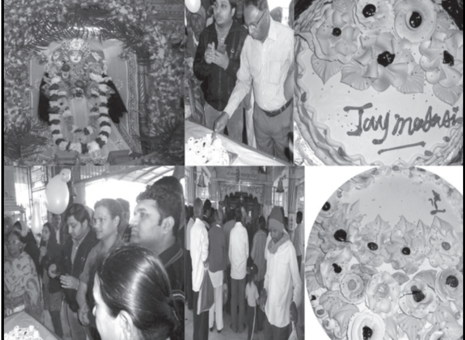
પોથી પુનમમાં જગત જનની જગદંબા માતાજીનો પ્રાગટ્ય દિનેન ધર્મભાવનાથી ઉત્સાહપૂર્વક તલોદ ખાતેના અંબાજી મંદિરમાં ઉજવવામાં આવ્યો હતો. માર્ઈ ભક્તોએ કેક કાપી ઉજવણી કરી હતી. (દશરથ વણજરા, તલોદ)